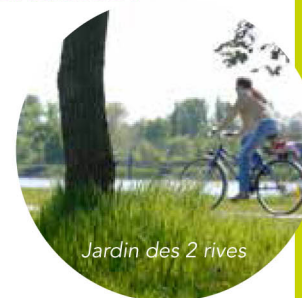
Jardin des 2 rives

Des accès sont possibles depuis toutes les gares de la Communauté urbaine de Strasbourg et de la ville de Kehl.