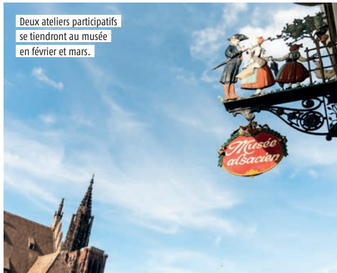
Deux ateliers participatifs se tiendront au musée en février et mars.

Les 4 février et 4 mars, de 10h30 à 12h. 23-25, quai Saint-Nicolas.