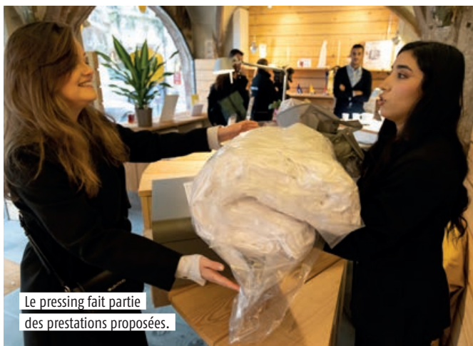
Le pressing fait partie des prestations proposées.

PRÊT DE MATÉRIEL DE BRICOLAGE Elle fait le relais entre les gens du quartier et une quantité de partenaires, majoritairement issus de l'économie sociale et solidaire, qui proposent, entre autres, de la garde d'enfants, de l'aide aux