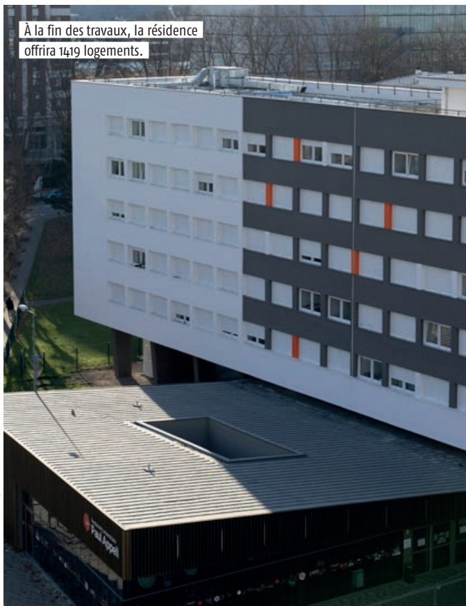
À la fin des travaux, la résidence offrira 1419 logements.

Construite en 1957, la cité U a vu défiler en ses murs pas moins de 87 000 étudiants depuis son ouverture, et ce n'est pas fini. « Depuis 2019, quatre bâtiments d'hébergement ont été rénovés, les deux derniers – actuellement fermés pour travaux – rouvriront à la rentrée universitaire 2023. La résidence offrira alors 1419 logements, soit 54 de plus qu'avant les travaux, dont onze studios accessibles aux personnes à mobilité réduite », ajoute Pierre Berthemet. Cette capacité d'hébergement permettra au Centre régional des œuvres universitaires et scolaires (Crous) de mieux répondre aux besoins des étudiants strasbourgeois dont les effectifs avoisinent les 55 000, alors qu'ils étaient 8000 seulement dans les années 1960. Une ancienne étudiante de