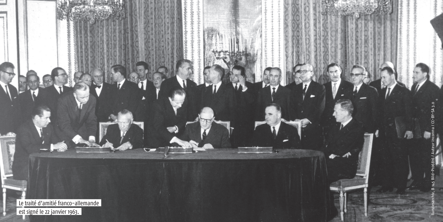
Le traité d'amitié franco-allemande est signé le 22 janvier 1963.