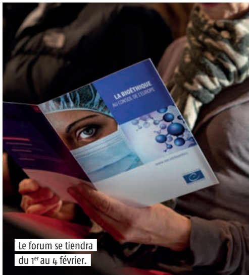
Le forum se tiendra du 1 er au 4 février.

à la ville inclusive et aux solidarités. Mais cela va plus loin. «Pour nous, c'est comme une étape qui reconnaît un statut d'habitant de la ville.» Le dispositif vise ainsi à restaurer le droit à la citoyenneté des sans-papiers, exilés et réfugiés et illustre la politique d'accueil et d'inclusion de la Ville. Un message également porté par les associations partenaires, Astu, le Collectif d'aide aux Afghans, le Centre Bernanos, Tunaweza et Casas, qui ont participé à la cérémonie