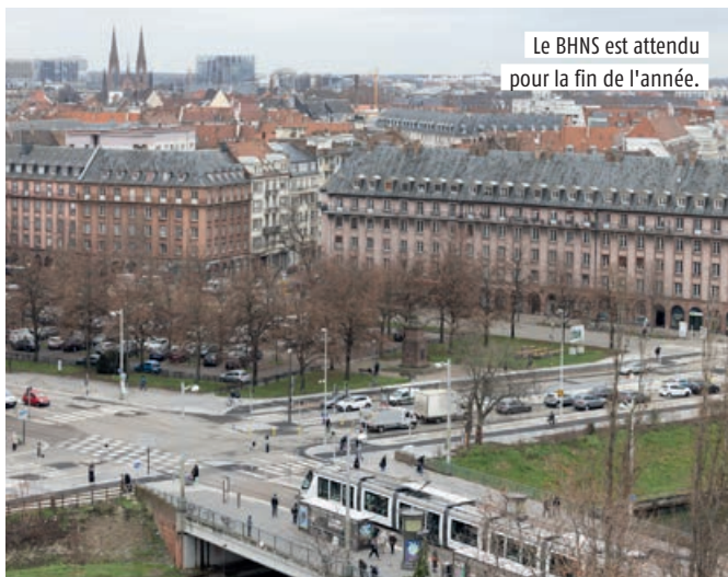
Le BHNS est attendu pour la fin de l'année.

aux piétons ont été élargis pour simplifier la montée et la descente du bus. À terme, les accès seront plus sûrs, les usagers descendront du tram et n'auront plus qu'une distance réduite à franchir pour rejoindre le bus, là où actuellement il leur faut traverser toute la route et la plateforme tramway. Au nord de la chaussée, du côté de la place De Lattre de Tassigny, une piste cyclable a été créée là où les cyclistes étaient tentés de rouler sur le trottoir. Au printemps, il restera à réaménager la piste cyclable de la rue de Vienne et le carrefour du quai des Alpes. Suivront ensuite des travaux sur le réseau d'eau, la reprise de l'enrobé (cet été), le marquage au sol et l'équipement des stations, ainsi que des travaux de finition (trottoirs, piste cyclable, végétalisation). Le BHNS circulera pour le prochain marché de Noël. ● Véronique Kolb