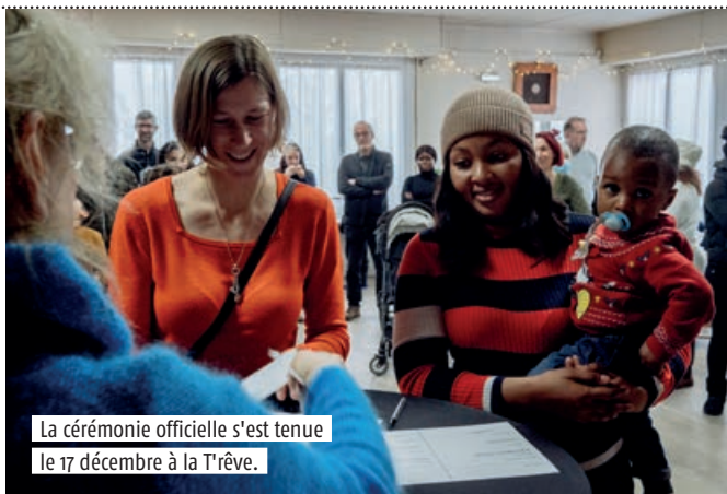
La cérémonie officielle s'est tenue le 17 décembre à la T'rêve.

À la T'rêve, c'est une pause, du répit et un peu de calme qu'on vient chercher. Pendant un an, le site va expérimenter l'accueil de jour: prendre une douche, déposer des affaires en toute sécurité, boire un café, trouver une oreille pour se confier ou se reposer, tout simplement. Mais des formations aux outils