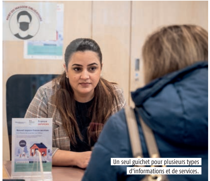
Un seul guichet pour plusieurs types d'informations et de services.

constituer son dossier, de déclarer un changement de situation familiale, d'accéder aux services de la CPAM (carte vitale, attestations, prise de rendez-vous) et de Pôle emploi (inscription en ligne, actualisation), de déclarer ses impôts, d'effectuer une pré-demande de carte d'identité ou de passeport, ou même de s'informer sur ses droits en cas de litige ou de conflit. Ce nouvel espace va considérablement améliorer la vie des citoyens et leur éviter de nombreux déplacements, parfois fastidieux, en centralisant un nombre important d'informations et de services en un seul et même lieu. De quoi justifier pleinement