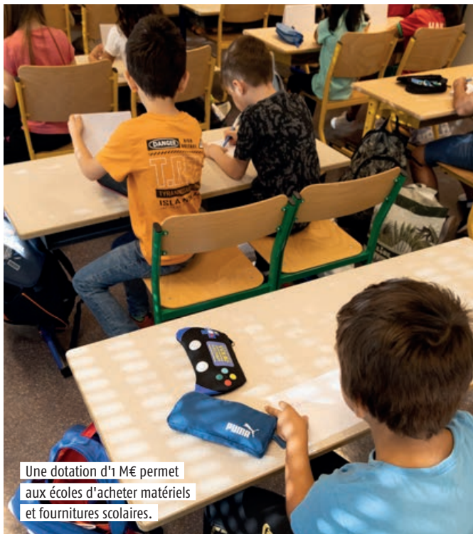
Une dotation d'1 M€ permet aux écoles d'acheter matériels et fournitures scolaires.

en fonction du quotient familial de chaque foyer, et les enfants issus de familles à très faibles revenus bénéficient de la cantine gratuitement. À cela s'ajoute une dotation d'un million d'euros pour les écoles publiques afin de permettre l'achat de fournitures scolaires et de petit matériel. « Le droit à une éducation gratuite dans nos écoles publiques doit être réel », insiste Hülliya Turan. Une enveloppe de 155 000 euros est également allouée pour le transport et 120 000 euros pour les sorties scolaires. Et pour garnir les rayons des bibliothèques scolaires, la Ville prévoit une commande de livres d'un montant de 85 000 euros. ● Anne Dory