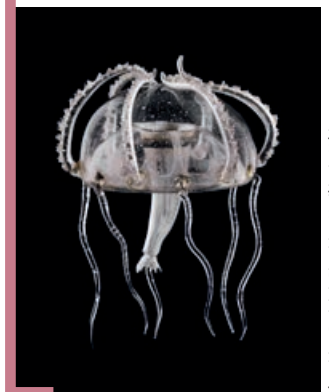
Léopold et Rudolf Blaschka. Modèle de Méduse, 1890.