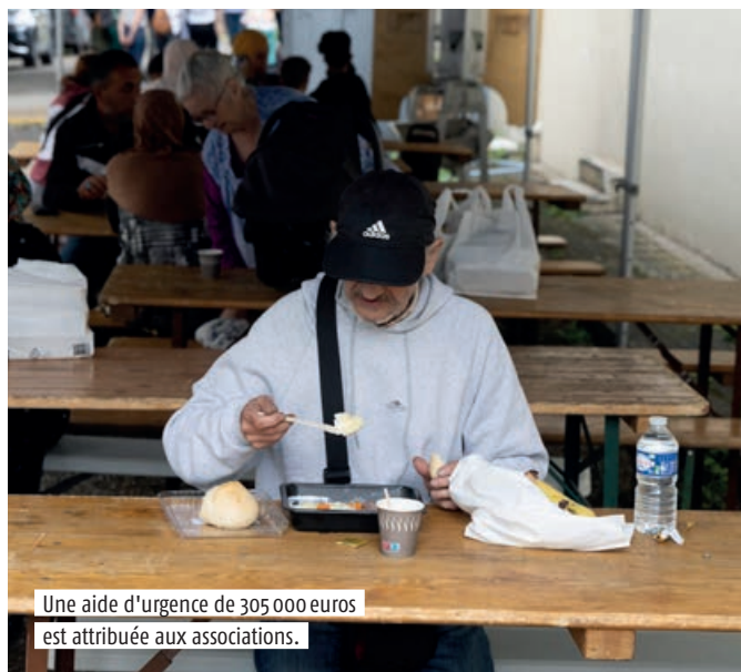
Une aide d'urgence de 305 000 euros est attribuée aux associations.