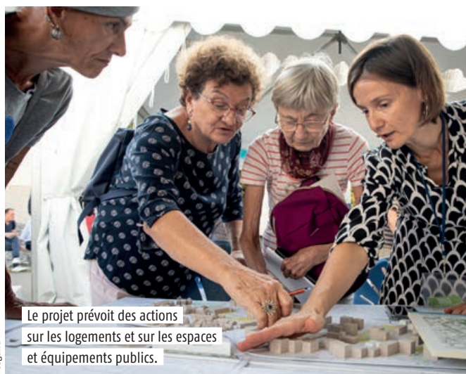
Le projet prévoit des actions sur les logements et sur les espaces et équipements publics.