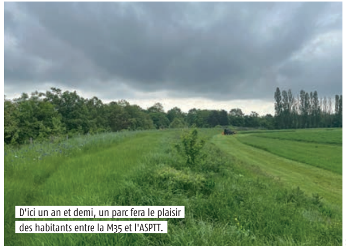
D'ici un an et demi, un parc fera le plaisir des habitants entre la M35 et l'ASPTT.

KOENIGSHOFFEN Entre la M35 et les terrains de l'ASPTT, un grand espace agricole est en pleine reconversion. Première étape d'une transformation majeure, le parvis du centre de formation des Compagnons du devoir, la place Vitruve, a été inaugurée en juin dernier. Couplée à l'espace de détente déjà aménagé sur la partie ouest des installations sportives, elle préfigure le tournant donné à cette entrée de quartier, au cœur de la ceinture verte, dont le devenir a été pensé avec les habitants. Un parc verra progressivement le jour au gré de travaux qui devraient démarrer début 2024. Ces derniers permettront de créer une grande aire de jeu en