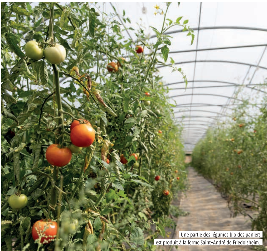
Une partie des légumes bio des paniers est produit à la ferme Saint-André de Friedolsheim.