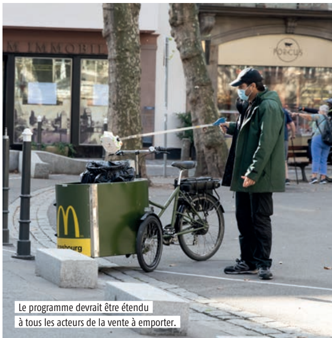
Le programme devrait être étendu à tous les acteurs de la vente à emporter.