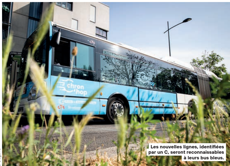
Les nouvelles lignes, identifiées par un C, seront reconnaissables à leurs bus bleus.

Strasbourg Mobilités, qui assure le service Vélhop depuis dix ans, a vu sa délégation de service public renouvelée pour la période 2023-2030. Cela s'accompagnera d'un renforcement de l'offre et d'une extension du maillage territorial, grâce notamment à de nouveaux partenaires comme La Poste, Transdev, Cadr67 ou encore Savoir et compétences et Nextbike. De quoi faire évoluer la gamme de bicyclettes avec des vélos classiques à chaînes, la multiplication par trois du nombre de vélos à assistance électrique (1200 au total), des vélos cargos pour tous les services et même des vélos adaptés pour un public moins à l'aise avec les bicyclettes classiques. Outre dans trois agences Vélhop, il sera possible de prendre des vélos dans seize agences de La Poste, 38 stations automatiques d'un nouveau genre (dès octobre) et dans des agences mobiles (300 jours d'animations par an).