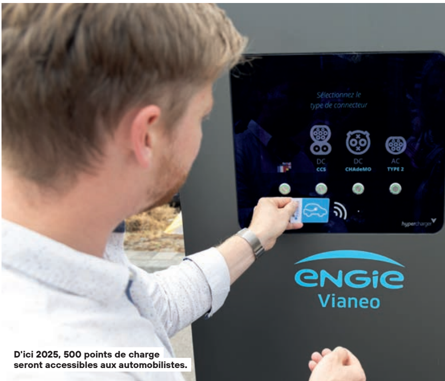
D'ici 2025, 500 points de charge seront accessibles aux automobilistes.