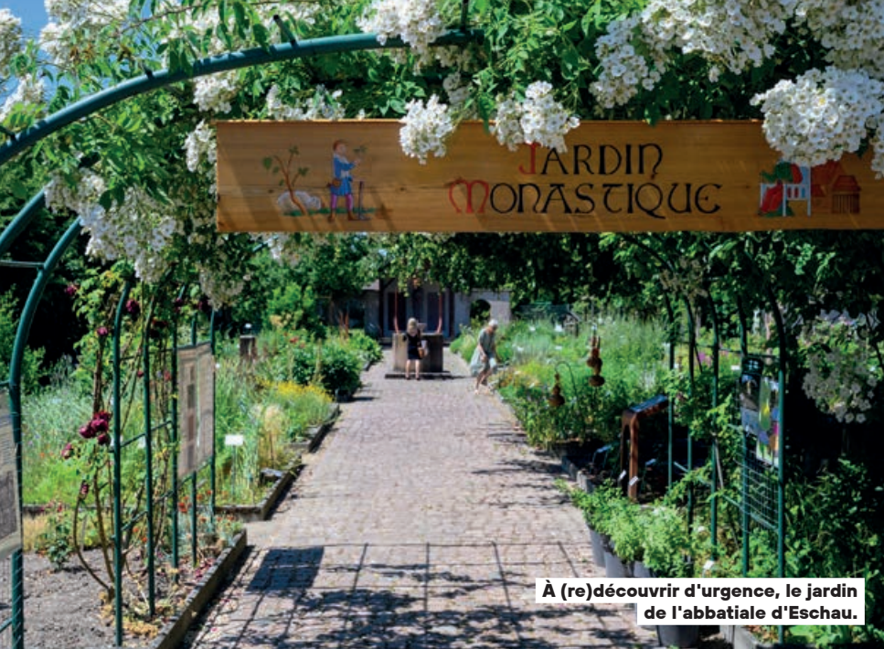
À (re)découvrir d'urgence, le jardin de l'abbatiale d'Eschau.