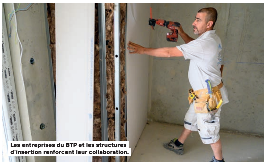
Les entreprises du BTP et les structures d'insertion renforcent leur collaboration.