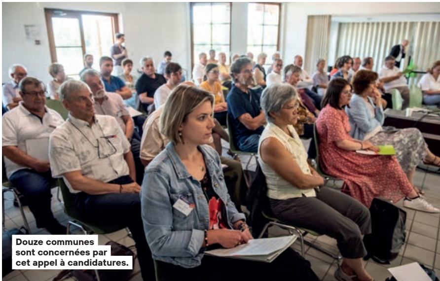
Douze communes sont concernées par cet appel à candidatures.

Pour participer aux grands enjeux de la métropole en faisant entendre sa voix, de nouveaux membres du Conseil de développement sont recrutés pour la période 2023-2026.