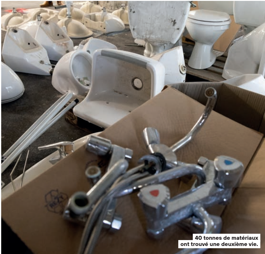
40 tonnes de matériaux ont trouvé une deuxième vie.

98,21% C'est le taux record de recyclage des matériaux atteint par le Crédit agricole Alsace-Vosges sur le chantier de déconstruction de son siège régional, place de la Gare à Strasbourg. Déconstruction et non démolition : la méthode douce confiée à la société Lingenheld est une des clés d'un résultat qui dépasse vaillamment les 70% prescrits par l'Union européenne.