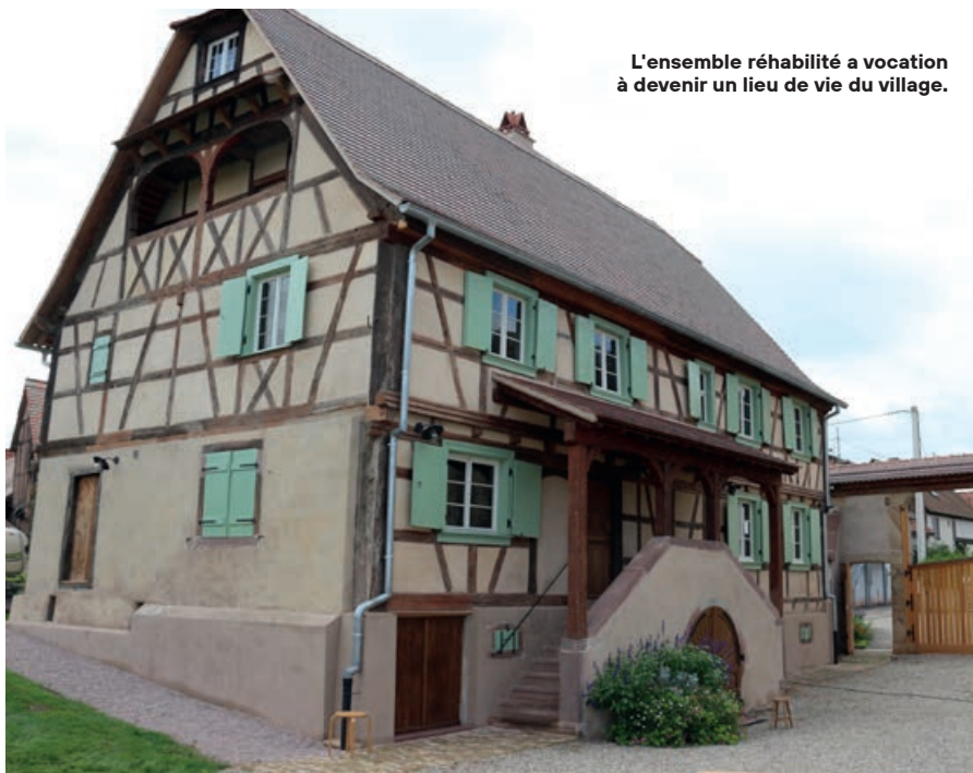
L'ensemble réhabilité a vocation à devenir un lieu de vie du village.