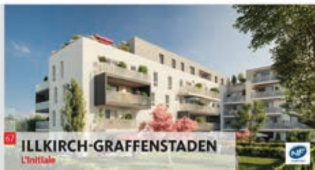
07 ILLKIRCH-GRAFFENSTADEN L'Initiale