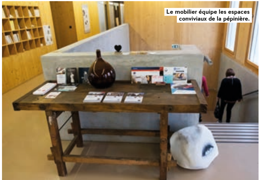
Le mobilier équipe les espaces conviviaux de la pépinière.

D es mange-debout réalisés par Envie avec des tambours de machine à laver ; un échiquier, un établi de présentation, des tables et des chaises chinés chez Emmaüs et à la Banque de l'Objet... La pépinière de HautePierre s'est dotée de mobilier de récupération et c'est une première. À la fois pour cette structure, qui accueille de jeunes entreprises, pour l'Eurométropole, pour les acteurs du réemploi et pour Sylvie Corbetta, architecte-décoratrice chargée de dénicher les meubles en question. Cette action a été initiée pour des raisons écologiques, économiques et solidaires : la collectivité donne ainsi une seconde vie à des fournitures destinées à être recyclées ou jetées, réalise