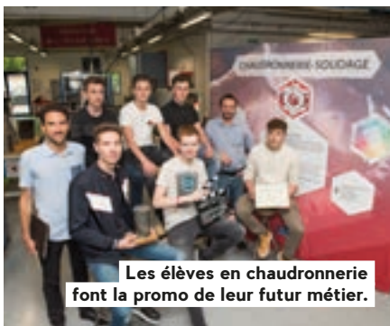
Les élèves en chaudronnerie font la promo de leur futur métier.