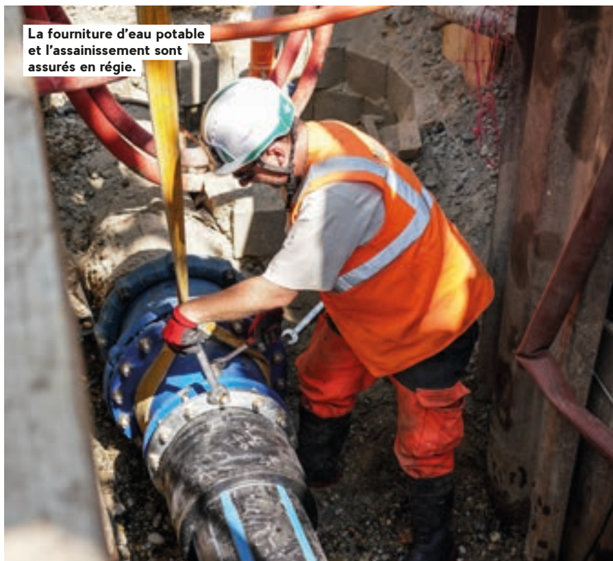
La fourniture d'eau potable et l'assainissement sont assurés en régie.

« En quelques années, j'ai observé l'essor incroyable des jardins de balcons. Une population plutôt jeune, qui ne possède pas de jardin, se lance avec enthousiasme dans ces plantations en pots dans l'idée d'accomplir un geste pour la biodiversité et de profiter d'un jardin nourricier. Et pas seulement du point de vue alimentaire. Ils cherchent aussi de la beauté. C'est vrai dans les jardins partagés, également en plein essor. Et tant mieux si les productions sont abondantes, cela permet le partage. Je répète souvent aux personnes qui participent aux conférences, stammtisch ou ateliers que j'anime qu'un jardin naturel n'est pas un style, mais un comportement joyeux qui améliore le pouvoir de non achat. Dans les autres tranches d'âge, démarre un mouvement de fond qui témoigne des préoccupations de beaucoup de gens. Ils se demandent comment agir en faveur de la planète, attendent parfois des réponses et des formations toutes faites : je redis qu'on réfléchit ensemble, qu'on s'adapte à chaque cas. Il reste que cette évolution est bien réelle... »