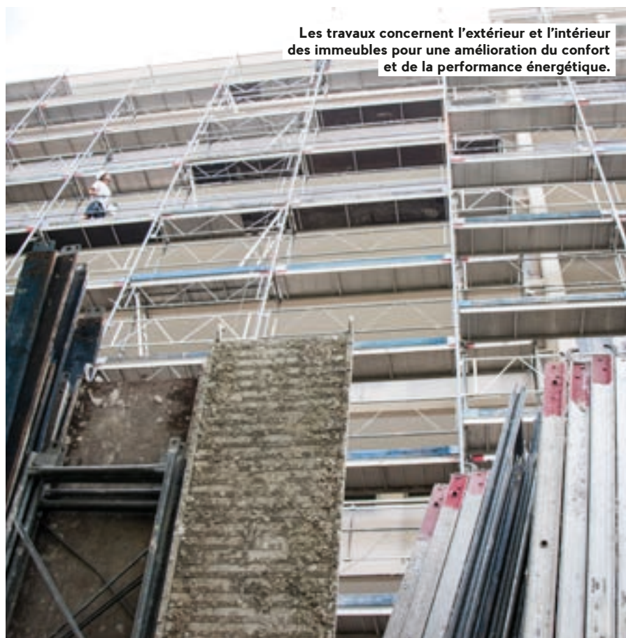
Les travaux concernent l'extérieur et l'intérieur des immeubles pour une amélioration du confort et de la performance énergétique.