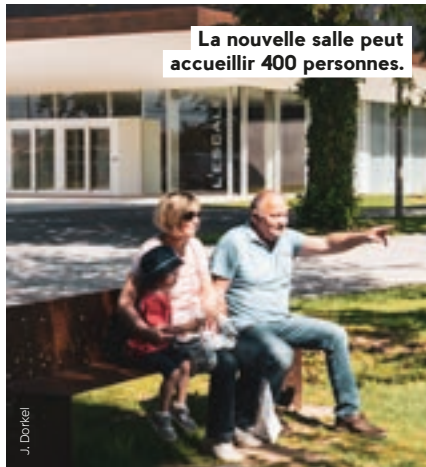
La nouvelle salle peut accueillir 400 personnes.