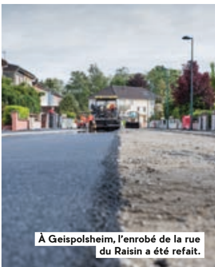
À Geispolsheim, l'enrobé de la rue du Raisin a été refait.

→ Les travaux rue d'Alsace à Illkirch auront lieu jusqu'à fin août. Des pistes cyclables sécurisées de part et d'autre de la voie seront créées, le stationnement sera revu, la vitesse sera limitée à 30 km/h aux abords de l'école maternelle et des arbres seront plantés pour verdifier la rue. ● Sophie Cambra