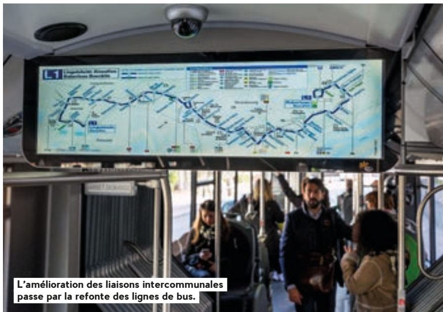
L'amélioration des liaisons intercommunales passe par la refonte des lignes de bus.

Les années du « tout voiture » sont finies depuis longtemps... Au moins dans une agglomération comme l'Eurométropole, où le développement d'infrastructures de transports en commun et de pistes cyclables remonte à quelques décennies. Au-delà de ce constat, la part des déplacements effectués en automobile demeure largement majoritaire. « Mes trajets quotidiens sont conditionnés par le parcours de bien des parents : arrêt au collège avec mon fils et un voisin, dépose de l'aînée à une station de tramway, direction mon boulot, dans un secteur difficilement joignable en transports en commun. C'est vrai je suis "autosoliste" une partie de mon trajet, mais nous mutualisons quand même bien le parcours », commente cet habitant d'une commune de seconde couronne.