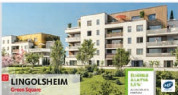
07 LINGOLSHEIM Green Square

ÉLIGIBLE À L'ATVA 5,3% ALLIANCE ENTRE PROPRIÉTAIRES