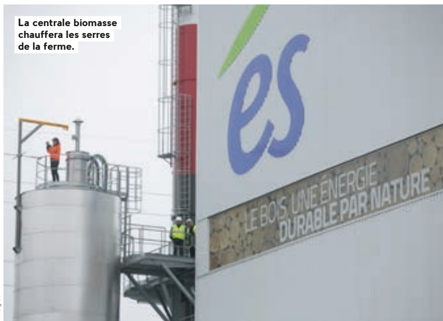
La centrale biomasse chauffera les serres de la ferme.

Infos complémentaires et conditions de trafic en temps réel disponibles sur Strasmap ou auprès du Sirac (03 88 84 84 84)