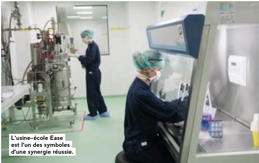
L'usine-école Ease est l'un des symboles d'une synergie réussie.

L institut de recherche contre les cancers de l'appareil digestif (Ircad) représente un porte-drapeau évident de la stratégie de développement des principaux points forts du tissu économique et intellectuel de l'Eurométropole de Strasbourg. «J'ai découvert que si les stars mondiales du foot ne foulaient pas –encore!– les pelouses du stade de la Meinau, nos Messi et autres sont dans les structures du secteur de la santé», constate la patronne d'une entreprise de fourniture de matériel médical de pointe.