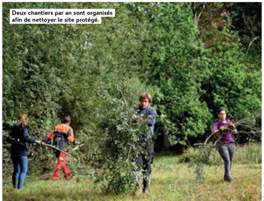
Deux chantiers par an sont organisés afin de nettoyer le site protégé.

L'Espace européen de l'entreprise, à Schiltigheim, n'est désormais plus une zone d'aménagement concertée (ZAC). L'aménagement de cet espace, qui a débuté en 1991, est achevé. La taxe d'aménagement (anciennement taxe locale d'équipement) sera par conséquent réinstaurée. L'Espace accueille aujourd'hui plus de 550 entreprises, près de 11 000 salariés, mais également des institutions comme la Chambre des métiers d'Alsace ou l'École européenne de chimie.