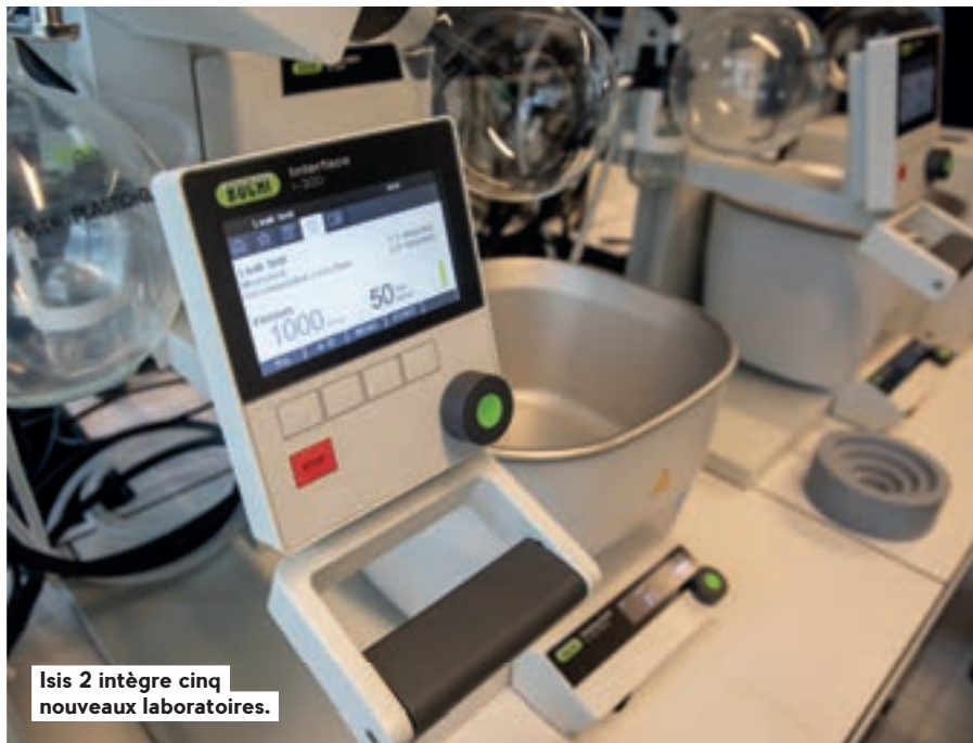
Isis 2 intègre cinq nouveaux laboratoires.

Depuis juin dernier, cinq start-up strasbourgeoises du domaine médical ont bénéficié d'un programme intensif et expérimental doté d'une enveloppe globale de 40 000 € financée par l'Eurométropole de Strasbourg. C'est la première fois que la collectivité s'investit autant à l'international pour soutenir les entreprises de son territoire. Pendant trois mois, des professionnels ont décortiqué leurs innovations et leurs business modèles pour l'adapter aux standards du marché américain. Les chefs d'entreprise de Defymed, Dianasic, SC Medica, Fizimed et Visible Patient avaient rendez-vous trois fois par semaine avec leur « coach ». Un séjour d'une dizaine de jours à Boston a bouclé ce programme d'accélération. Les entrepreneurs ont pu y rencontrer de gros acteurs du domaine de la santé.