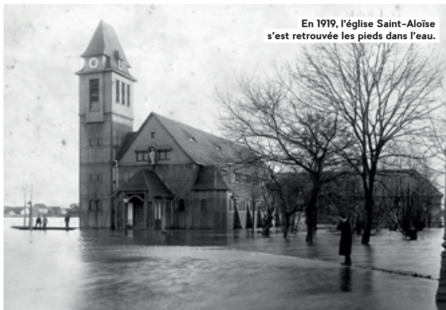
En 1919, l'église Saint-Aloïse s'est retrouvée les pieds dans l'eau.