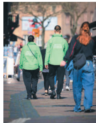
L'équipe sera composée à terme de 12 personnes.

Un dispositif est testé pour prévenir les incivilités et les violences sexistes et sexuelles.