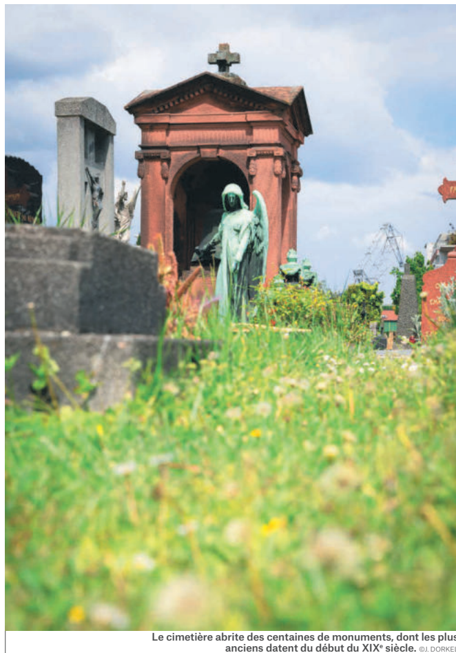
Le cimetière abrite des centaines de monuments, dont les plus anciens datent du début du XIX e siècle.

GUIDE DES CIMETIÈRES N°1, STRASBOURG-NEUDORF, CIMETIÈRE SAINT-URBAIN, VILLE DE STRASBOURG, 2007 (DISPONIBLE À L'ENTRÉE DU CIMETIÈRE)