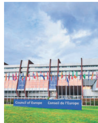
Conférences, expositions et podcasts sont prévus.

Né en 1949 au sortir de la Seconde Guerre mondiale, le Conseil de l'Europe fête cette année son 75 e anniversaire.