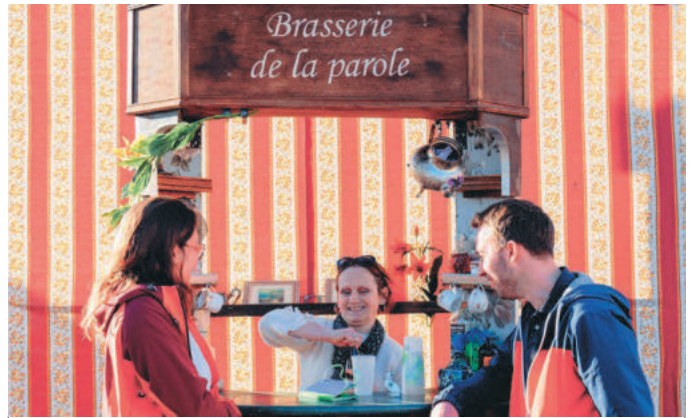
Un verre contre un propos: en octobre et en mars, la place a été transformée en lieu d'échanges.

La Brasserie de la parole, imaginée par le CSC et la compagnie les Arpentistes, fait partie des 17 projets retenus par la Ville et a permis de transformer temporairement, en octobre et en mars, la place d'Ostwald en terrasse conviviale. Là, les passantes et passants ont pu venir s'attabler et «échanger» un verre contre un «souvenir, un coup de cœur, un coup de gueule»,