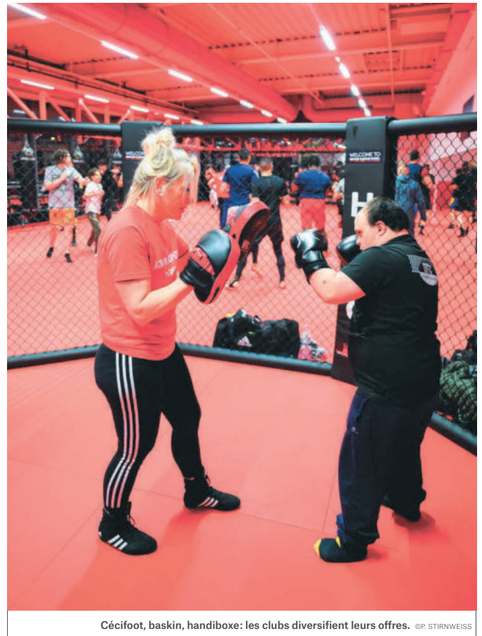
Cécifoot, baskin, handiboxe: les clubs diversifient leurs offres.

→ Le passage de la flamme paralympique à Strasbourg, le 25 août. Les structures d'accueil et les associations spécialisées participeront aux manifestations entourant cette étape locale du parcours de la flamme vers Paris. {LG}