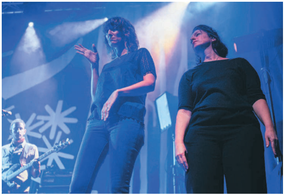
Des concerts chansignés sont proposés aux personnes sourdes ou malentendantes.

À titre d'exemple, l'association Vue (d') ensemble œuvre pour une meilleure prise en compte du public mal-voyant et non-voyant. «Depuis une dizaine d'années, la question de l'accessibilité se démocratise, apprécie son président Yves Wansi. Les