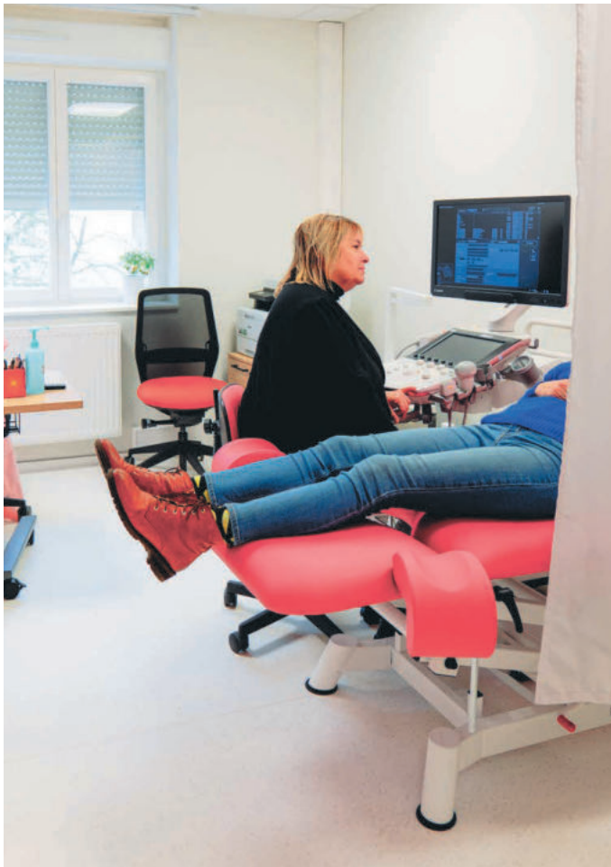
Suivi gynécologique, préparation à l'accouchement et échographies peuvent être pratiqués sur place.

La Maison urbaine de santé du quartier réunit un écosystème de soignants-es au service de la population.