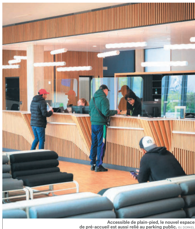
Accessible de plain-pied, le nouvel espace de pré-accueil est aussi relié au parking public.

DÉMARCHES EN LIGNE ACCESSIBLES SUR MONSTRASBOURG.EU