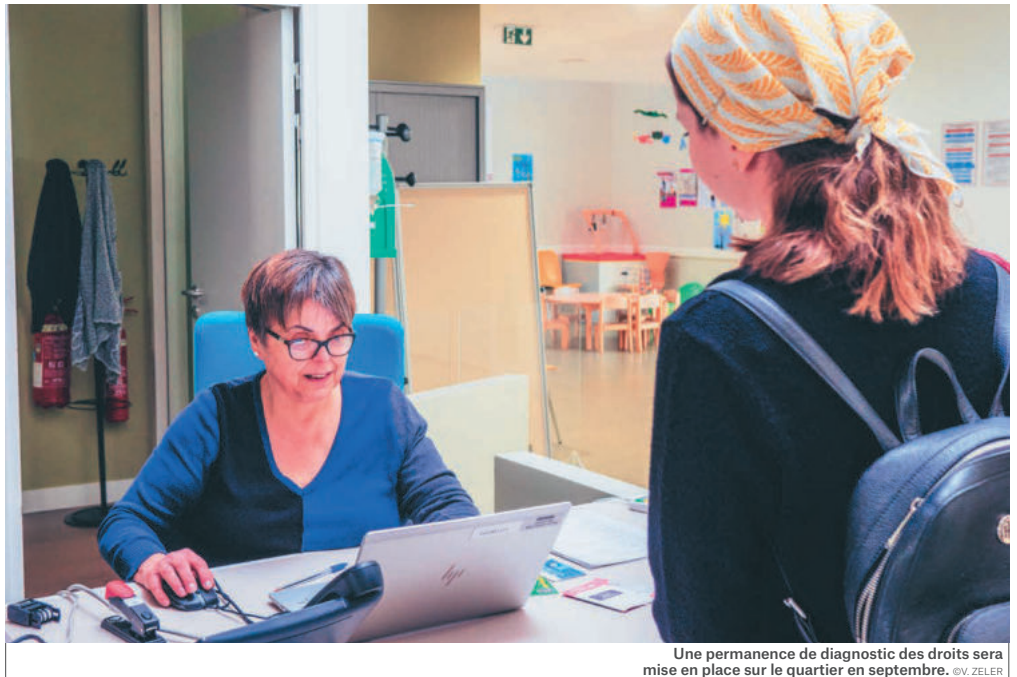
Une permanence de diagnostic des droits sera mise en place sur le quartier en septembre.