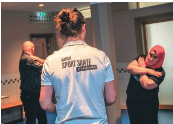
Depuis 2012, plus de 5000 personnes ont pu bénéficier d'activités physiques adaptées à leurs pathologies.