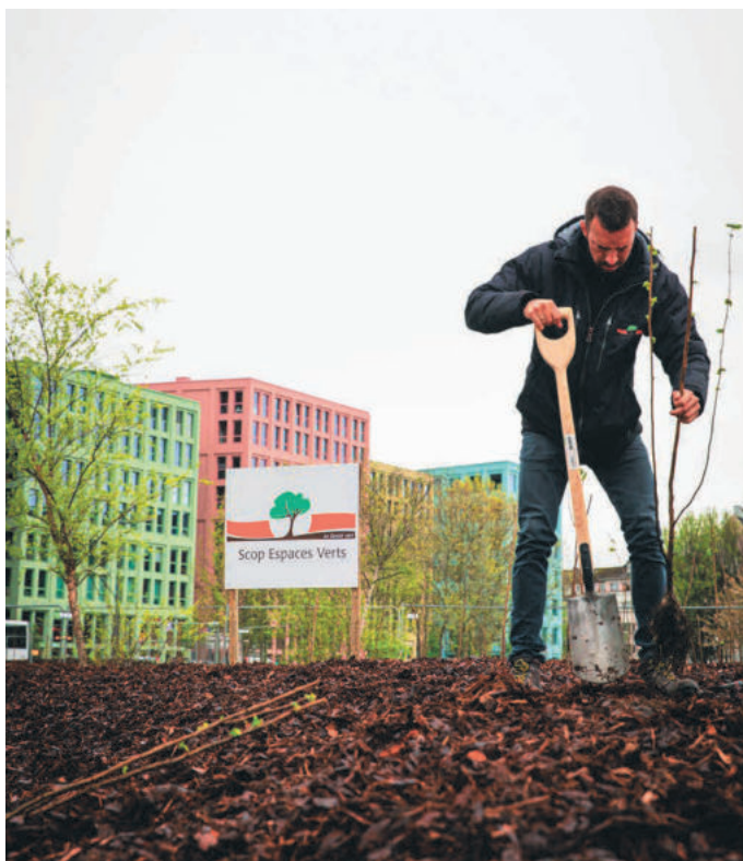
Avant les plantations, le sol a été travaillé pour le rendre à nouveau vivant.

Depuis le 4 avril, le site web strasbourg.eu affiche sa nouvelle identité: fond sombre pour réduire les coûts énergétiques, couleurs contrastées pour une meilleure accessibilité, architecture plus adaptée à la lecture sur smartphone. Plus sobre et plus accessible, la newsletter l'est aussi avec un changement de format et de périodicité, qui devient hebdomadaire. Sur le site, les articles d'actualité sont mis en avant dès la page d'accueil, où l'on retrouve également un moteur de recherche et une navigation par profil usager ou par thématique. {LG}