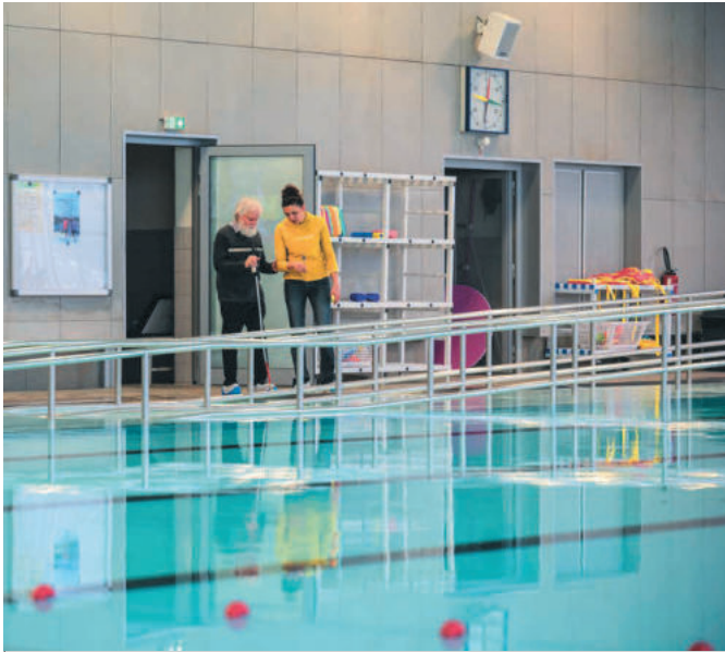
Des visites sont organisées pour identifier les freins à l'autonomie des nageurs handicapés.