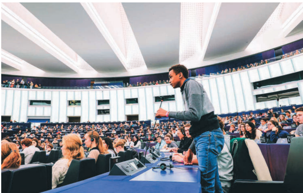
Une séance de questions-réponses a eu lieu entre les jeunes et le vice-président.