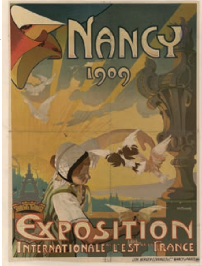
Nancy 1909 : Exposition Internationale de l'Est de la France.

DIMENSION POLITIQUE «Nous voulions proposer un regard actuel sur ce moment d'histoire partagé entre Strasbourg et Nancy, à travers des documents d'époque, des cartes postales, des tableaux, mais aussi une reconstitution dans la cour du musée de ce village alsacien factice, détaille Marie Pottecher. Ce sera aussi l'occasion de