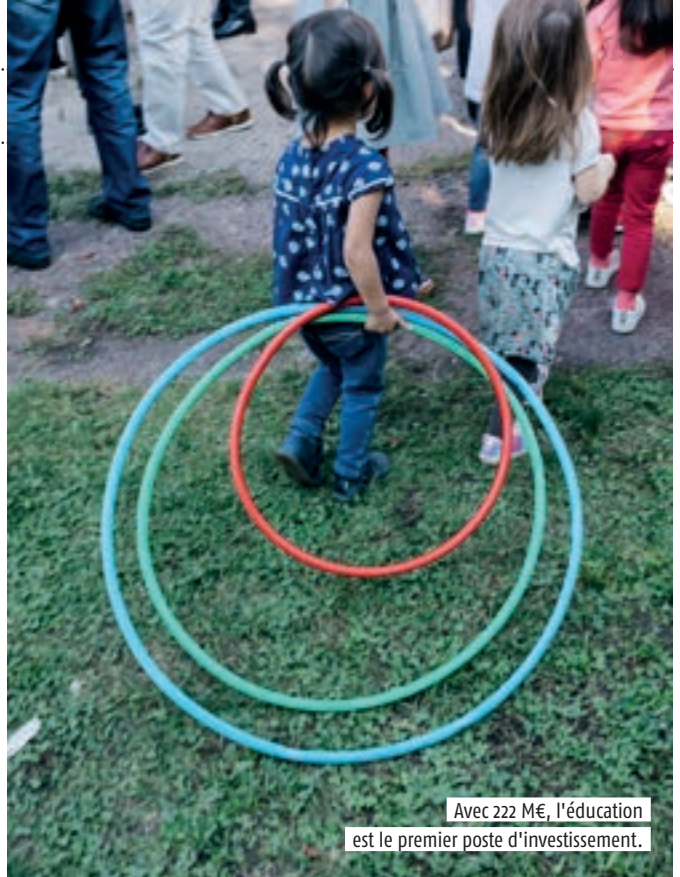
Avec 222 M€, l'éducation est le premier poste d'investissement.