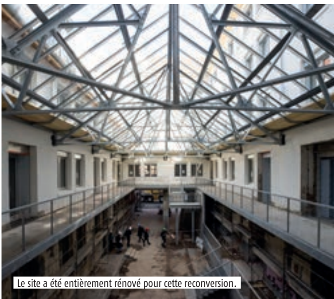
Le site a été entièrement rénové pour cette reconversion.

et services. Un café et une conciergerie solidaire s'installeront sous la verrière de la cour intérieure du même bâtiment. Le rez-de-chaussée de l'ancienne Administration deviendra une salle événementielle modulable de 320 m 2 . « Ce sera un lieu de rencontres, que nous mettrons à disposition du centre socio-culturel du Port du Rhin et qui pourra être privatif », ajoute Agathe Binnert. Cooproduction, la MDE et la Chambre régionale de l'économie sociale et solidaire partageront le premier étage, qui comprendra aussi un espace de coworking. « 30% de cette surface est encore disponible pour toute personne ou structure qui partage nos valeurs. » Le KaléidosCOOP sera livré en décembre puis l'aménagement intérieur commencera pour une ouverture prévue à l'été 2022. ● Léa Davy