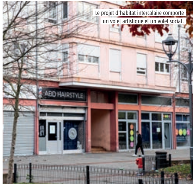
Le projet d'habitat intercalaire comporte un volet artistique et un volet social.

APPROCHE SUR MESURE Il s'agit pour Caracol de faire cohabiter Français, étrangers, réfugiés, étudiants, personnes disposant d'un emploi ou en recherche, « avec des perspectives de découverte