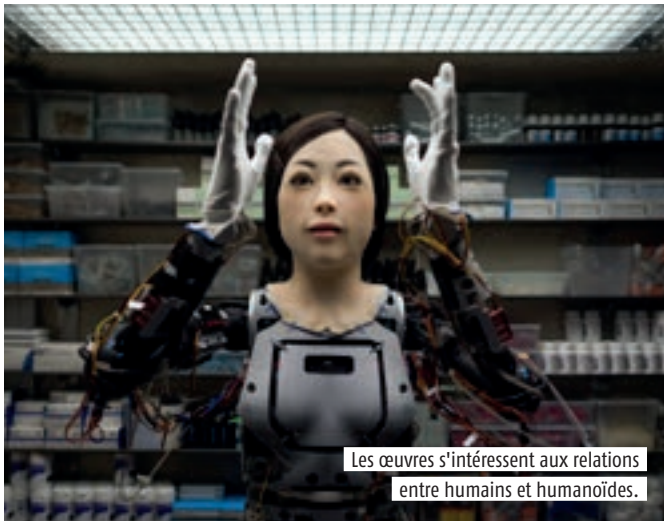
Les œuvres s'intéressent aux relations entre humains et humanoïdes.

En janvier, le Maillon propose Paranoid androids, une programmation qui interroge notre rapport au progrès technologique.