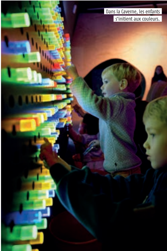
Dans la Caverne, les enfants s'initient aux couleurs.