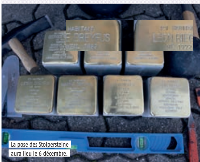
La pose des Stolpersteine aura lieu le 6 décembre.

un projet d'installation d'étagères et de cadres dans les halls d'immeubles, sur lesquels pourront circuler dessins, poèmes, livres ou recettes de cuisine, a été plébiscité. Dimanche, Nada, adolescente kurde syrienne, arrivée à l'Elsau il y a quatre ans, est venue à la nuit tombée avec ses dessins. « J'aimerais vous les montrer », a-t-elle dit dans un français parfait et un immense sourire. ● Gilbert Reilhac