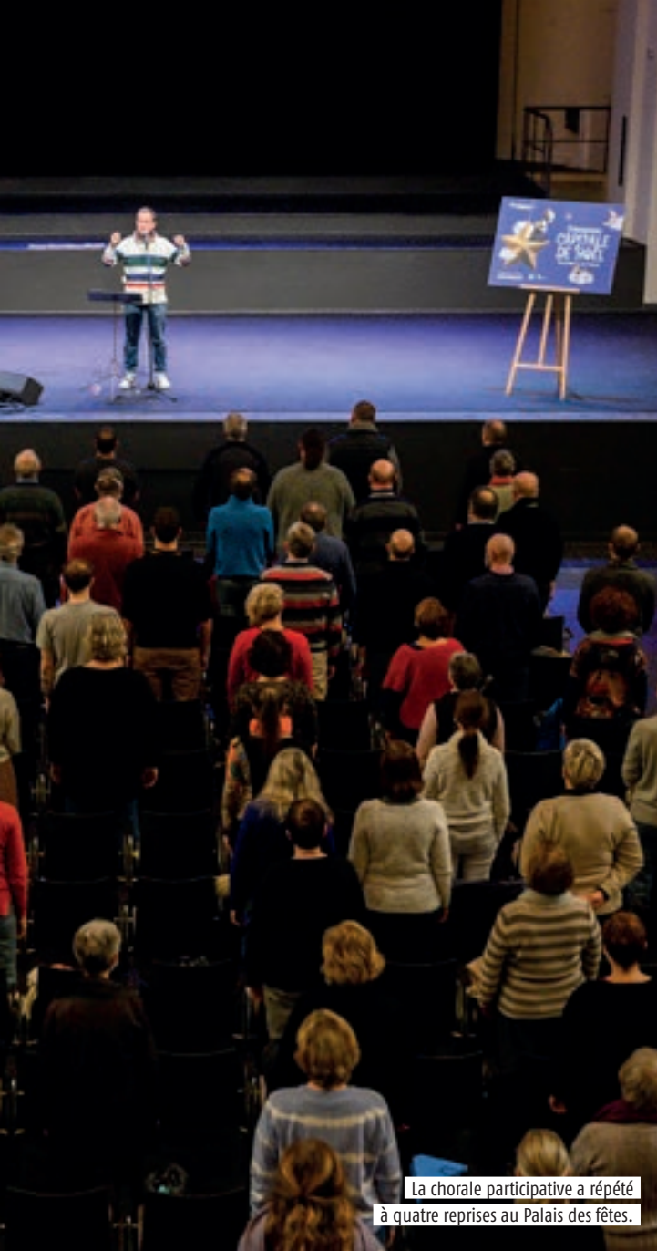
La chorale participative a répété à quatre reprises au Palais des fêtes.

la casse, qui sera ensuite installée barrage Vauban. Le 18 décembre, toujours au barrage Vauban, il sera encore une fois invité à participer à l'installation immersive de la troupe FireWorxx.