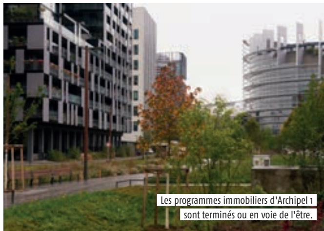
Les programmes immobiliers d'Archipel 1 sont terminés ou en voie de l'être.

Lancée depuis 2018, la seconde phase du projet urbain du Wacken est aujourd'hui réorientée.