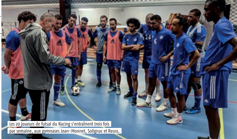
Les 20 joueurs de futsal du Racing s'entraînent trois fois par semaine, aux gymnases Jean-Monnet, Solignac et Reuss.