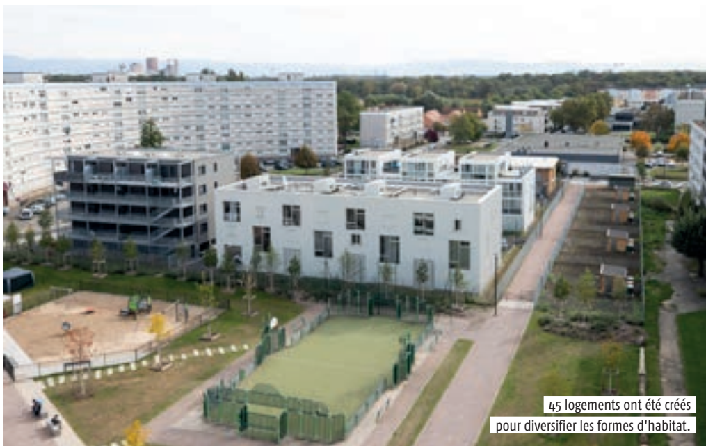
45 logements ont été créés pour diversifier les formes d'habitat.