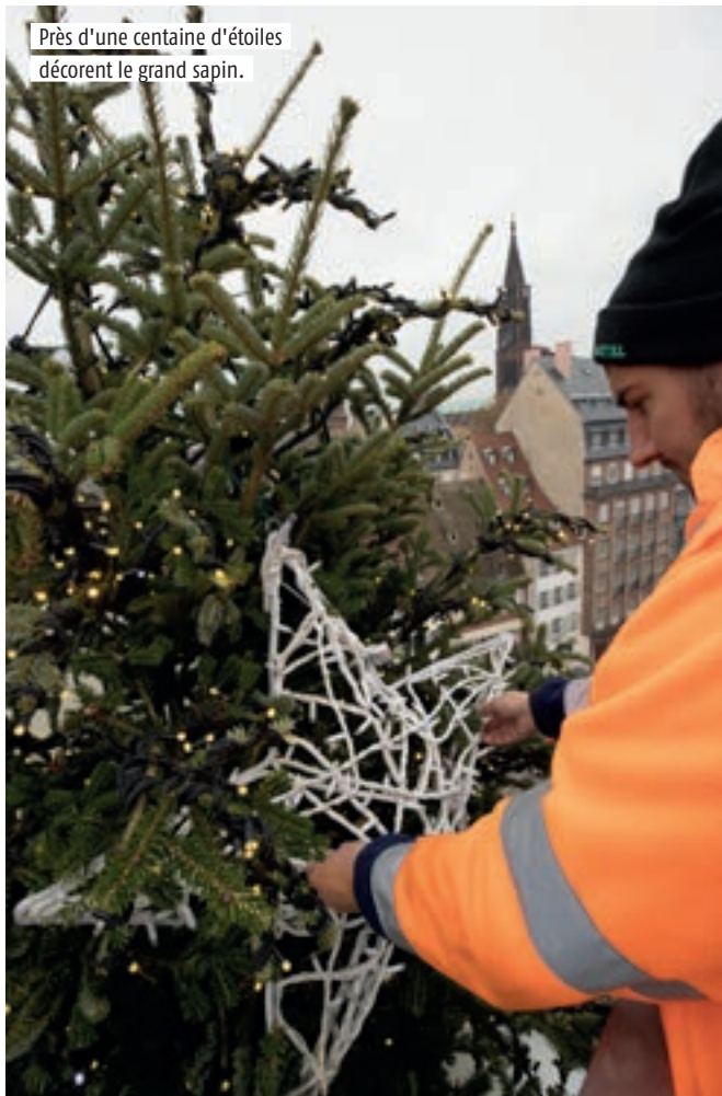
Près d'une centaine d'étoiles décorent le grand sapin.

les fêtes jusqu'au 2 janvier. Enfin, chaque samedi, des spectacles animeront la ville. Le 27 novembre, la compagnie Libellune déploiera une grande fresque enflammée place du Quartier Blanc. Le 4 décembre, les artistes de Motus Module et La Salamandre proposeront «danses rituelles et ballet en apesanteur» au square Louise Weiss puis au barrage Vauban. Les 10 et 11 décembre, le public pourra créer une installation participative avec la compagnie La Rue de