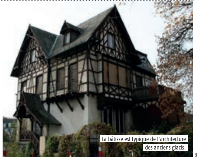
La bâtisse est typique de l'architecture des anciens glacis.

«L'enjeu est de préserver cet exemple d'une architecture particulière, très largement sacrifiée à Strasbourg, tout en permettant l'installation d'une activité qui participe de la valorisation du quartier», explique Patrick Rockemer, responsable du plan patrimoine au sein de la collectivité. Aucun type d'affectation n'est a priori exclu, afin d'ouvrir la consultation à une diversité de porteurs de projet, qu'ils soient associatifs, entreprises ou particuliers. A charge pour