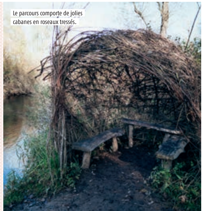
Le parcours comporte de jolies cabanes en roseaux tressés.

esquive les souches, on se baisse pour progresser sous le couvert végétal et on admire les vieux arbres. De jolies vues sur les différents bras du Rhin vous attendent, ainsi que de nombreux oiseaux, libellules et grenouilles. Attention : au début du sentier, une jauge indique le niveau de l'eau. Si ce dernier est trop élevé (dans le rouge), le polder est inondé et donc inaccessible. Dans tous les cas, privilégiez les bottes ou des chaussures de rechange pour la boue. Pour accéder au circuit, balisé «W Auen Wildnispfad Neuried», gardez-vous sur le parking du Forum européen du Rhin, sur la route L98, juste après le pont Pflimlin. Il est aussi possible de s'y rendre à vélo ou avec le transport à la demande Flex'hop, à réserver à l'avance. ● Léa Davy