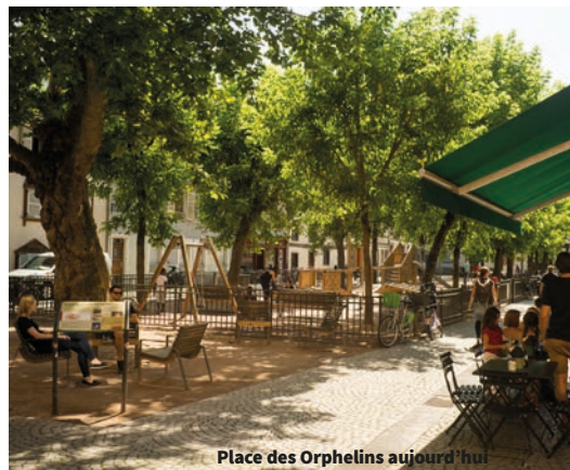
Place des Orphelins aujourd'hui