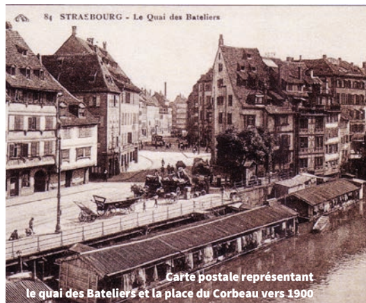
Carte postale représentant le quai des Bateliers et la place du Corbeau vers 1900