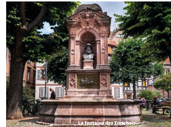
La fontaine des Zurichois

Über den Rheingiessen spannte sich einst der Katzensteg (Passerelle des Chats), der 1734 in eine Schleuse umgebaut wurde. Er war der Namensgeber der Place du Pont-aux-Chats, auf der sich einer der ältesten Brunnen der Stadt (1884) befindet. Der „Zürcher Brunnen“ gedenkt der Freundschaft zwischen Strasbourg und Zürich: Der Erzählung nach fuhren die Züricher im Jahr 1576 den Rhein flussaufwärts; dabei führten sie einen Kessel mit heißem Hirsebrei