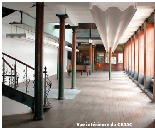
Vue intérieure du CEAAC