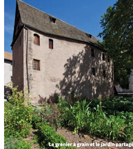
Le grenier à grain et le jardin partagé