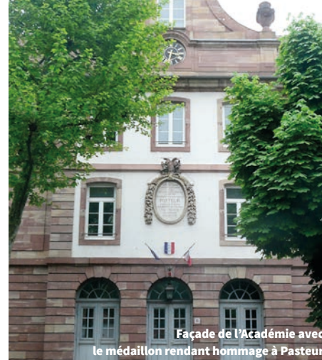
Façade de l'Académie avec le médaillon rendant hommage à Pasteur