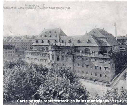
Carte postale représentant les Bains municipaux vers 1915

St. William's church was built outside the city walls in 1307, originally as a monastery. Its sober, unvaulted brickwork architecture is typical of the order of St. William. It was chosen by the newly-formed boatmen and fishermen's Guild as their church, as illustrated by the anchor perched on the clock tower. From 1534 onwards, it became part of the Lutheran movement. It has kept its mediaeval stained-glass windows, a stone rood screen dating from 1485, a chair from 1656 and the richly decorated tombs of the counts of Werd (1344), to the rear of the choir. The clock tower, built in 1667, is trapezoid in shape and curiously lopsided. The Wilhelmer choir was formed in the church in 1885 by Ernest Munch and still gives regular concerts there. The young Albert Schweitzer often played the church's Silbermann organ.