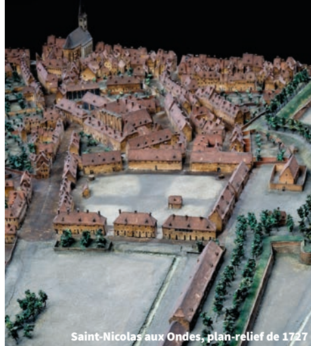
Saint-Nicolas-aux-Ondes, plan-relief de 1727