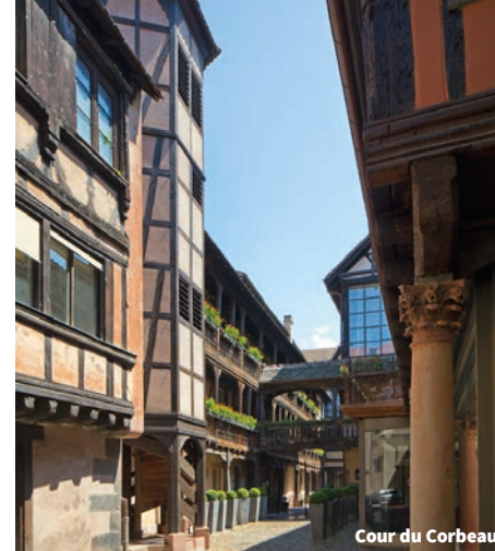
Cour du Corbeau