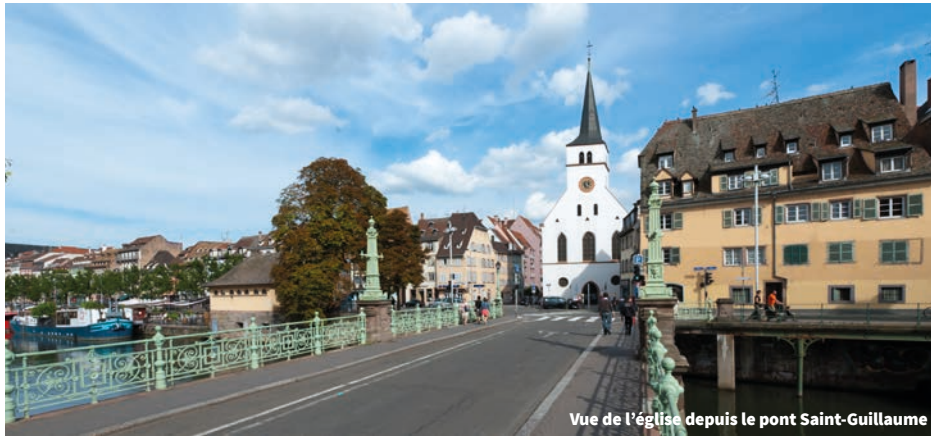
Vue de l'église depuis le pont Saint-Guillaume