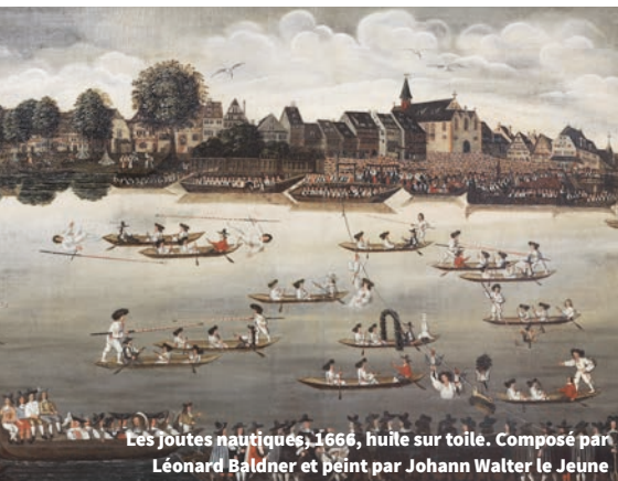
Les Joutes nautiques, 1666, huile sur toile. Composé par Léonard Baldner et peint par Johann Walter le Jeune