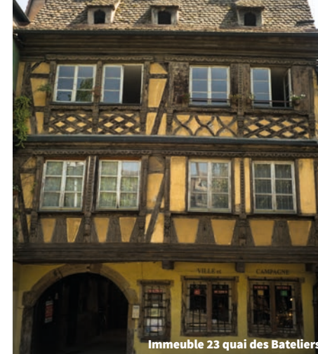
Immeuble 23 quai des Bateliers