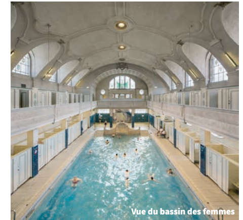
Vue du bassin des femmes

Die 1908 eingeweihte städtische Badeanstalt war die Antwort auf ein ambitioniertes Programm: Im Zuge der städtischen Erweiterung (Neustadt) anstelle der ehemaligen Befestigungsanlagen stattete sie die Stadt mit einem modernen Bad unter zwei Gesichtspunkten - Gesundheitswesen und soziale Durchmischung - aus. Ihre komplexe Architektur nach Plänen Fritz Beblös inspirierte sich am historistischen Heimatstil mit Jugendstil-Einflüssen. Die Badeanstalt verfügt