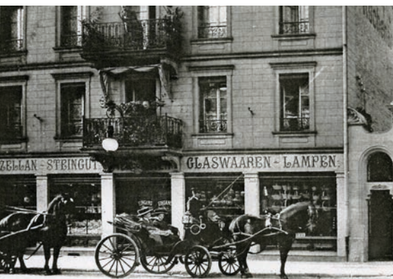
Les établissements Neunreiter