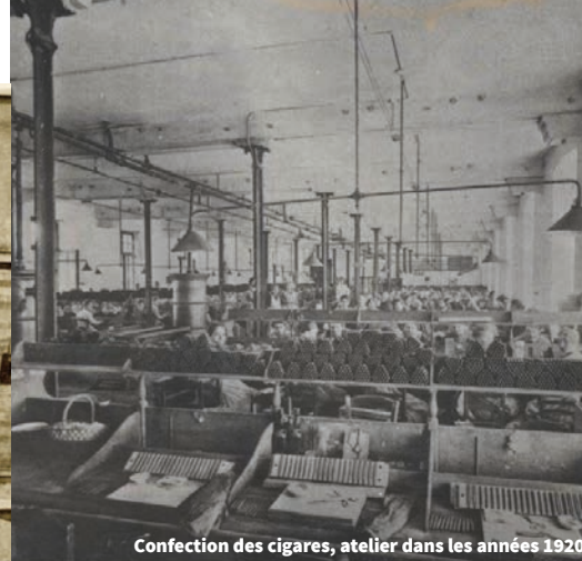
Confection des cigares, atelier dans les années 1920