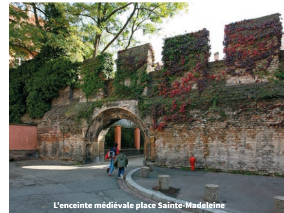
L'enceinte médiévale place Sainte-Madeleine