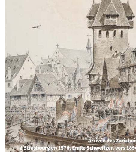
Arrivée des Zurichois à Strasbourg en 1576, Emile Schweitzer, vers 1894

The Au Renard Prêchant restaurant is housed in an old 16 th -century chapel and derives its name from the mediaeval theme of the preaching fox, who dressed as a monk to gain the confidence of chickens (or geese) before gobbling them up. The story has inspired a number of local legends, including one about a dispute between a preacher and a duck breeder, who were neighbours. The former accused a fox of talking the breeder's ducks into giving themselves up to him, while it was actually the preacher himself who was stealing them.