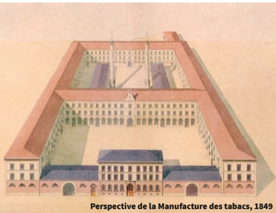
Perspective de la Manufacture des tabacs, 1849