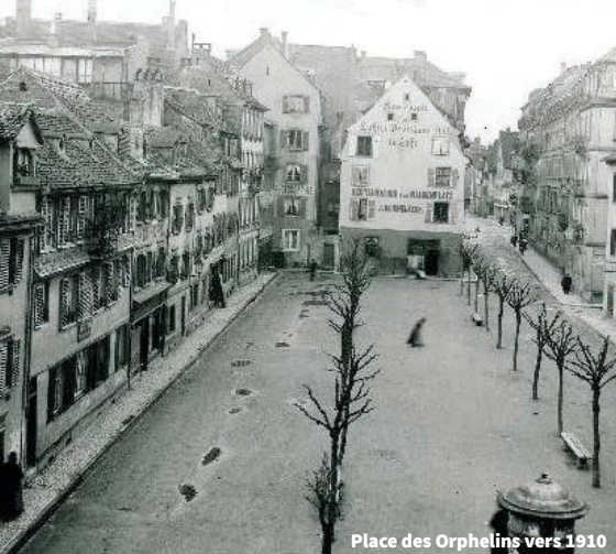
Place des Orphelins vers 1910