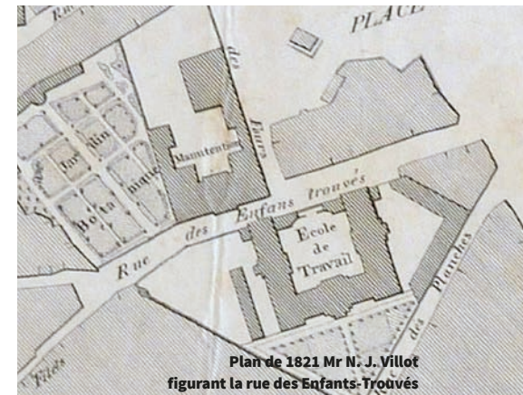
Plan de 1821 Mr N. J. Villot figurant la rue des Enfants-Trouvés