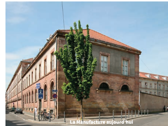
La Manufacture aujourd'hui