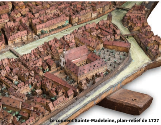
Le couvent Sainte-Madeleine, plan-relief de 1727