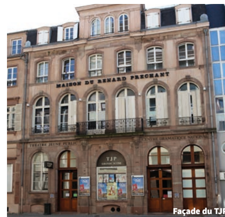
Façade du TJP