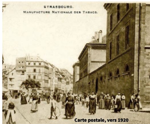
Carte postale, vers 1920