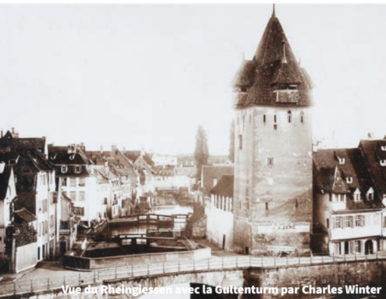
Vue du Rheinglessen avec la Gultenturm par Charles Winter