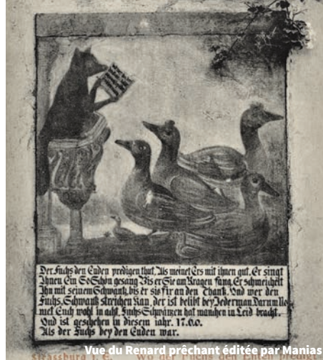
Vue du Renard prêchant éditée par Manias