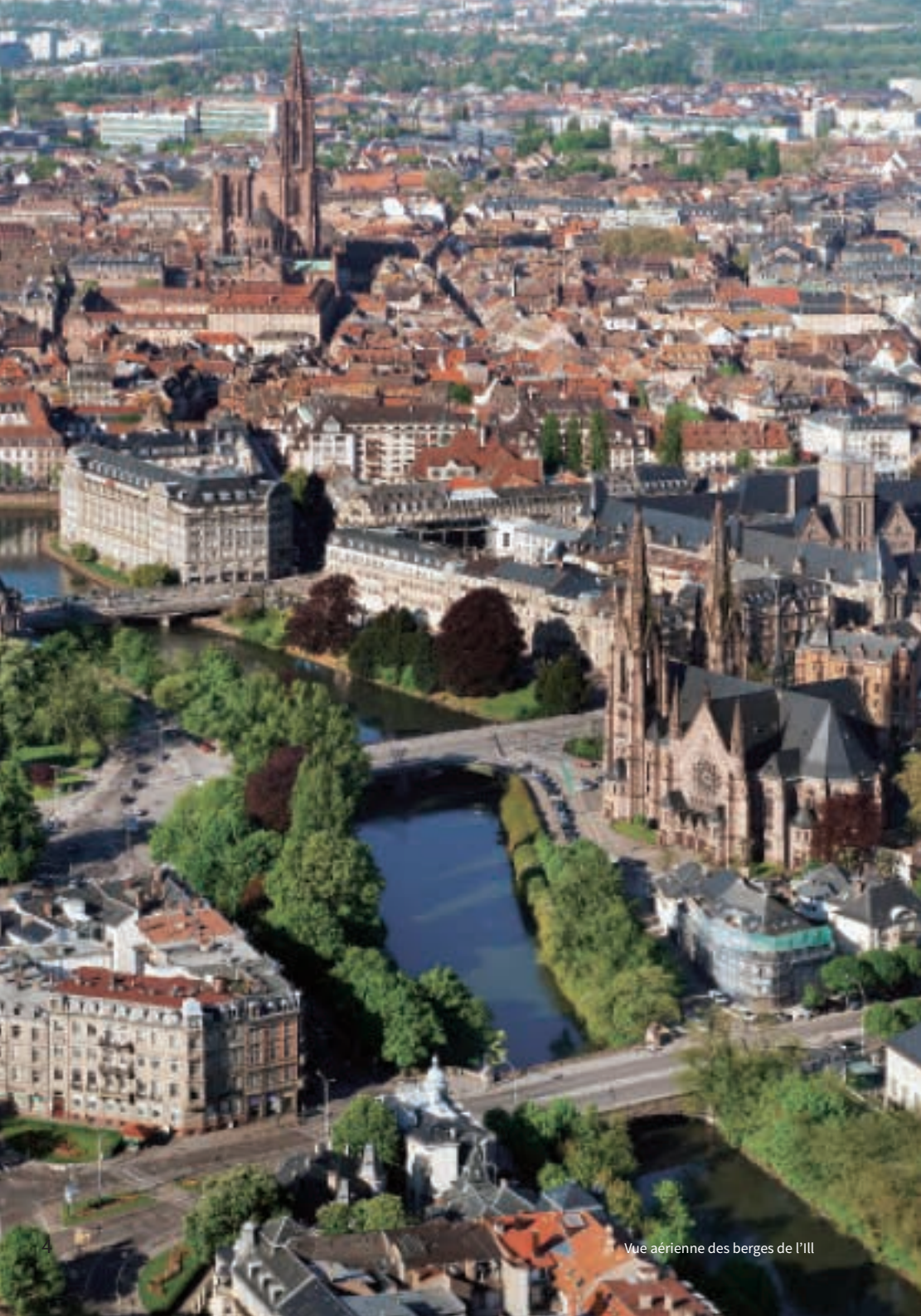
Vue aérienne des berges de l'Ill