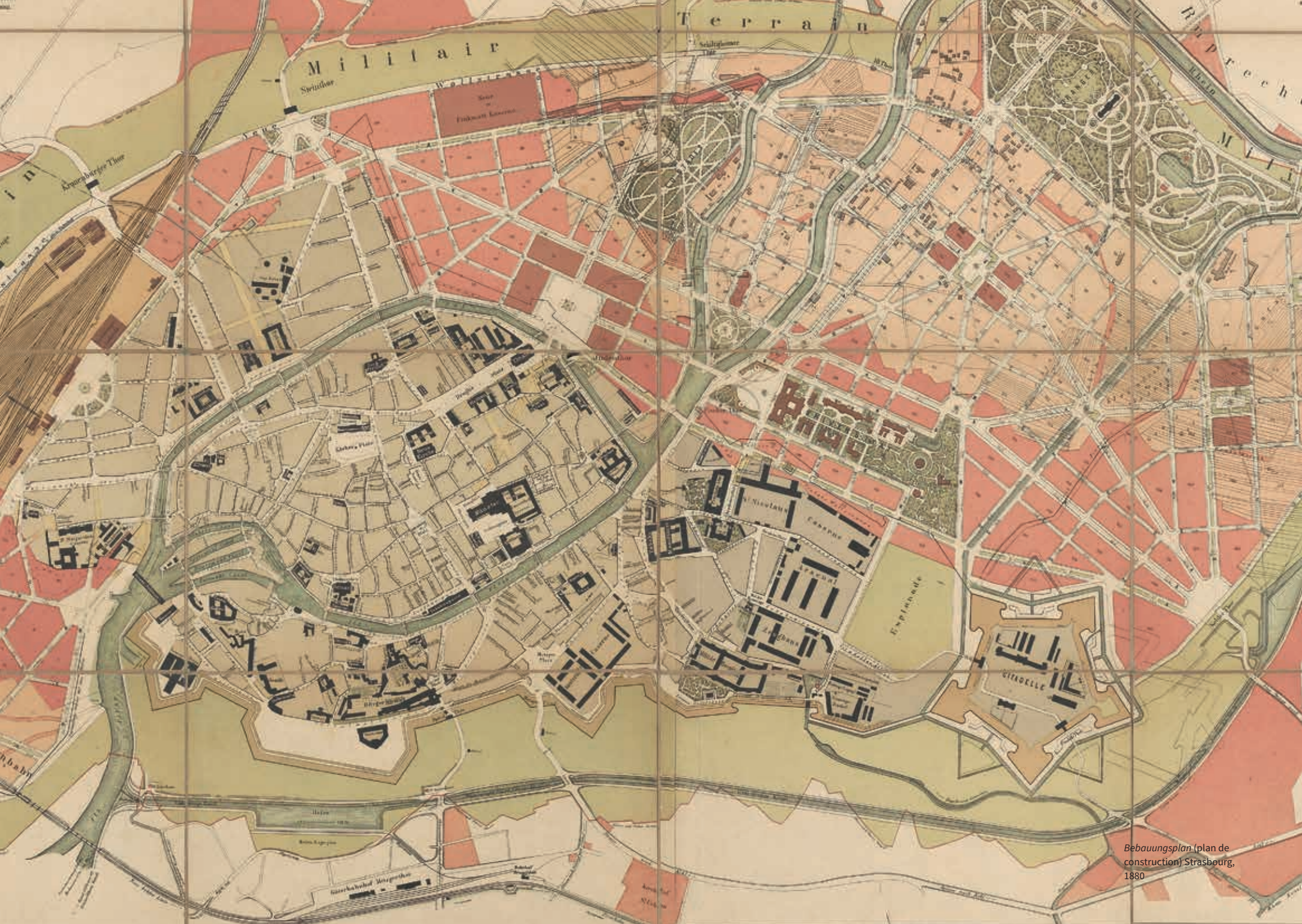
Bebauungsplan (plan de construction) Strasbourg, 1880