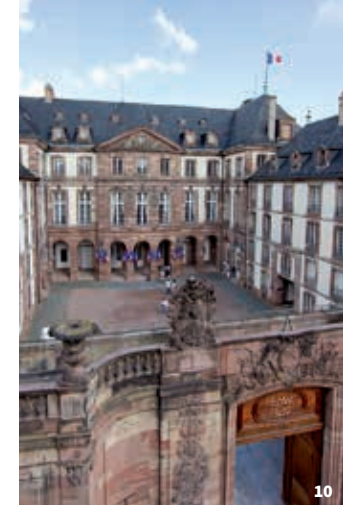
7. Perspective sur la rue des Orfèvres

The Regency-style Hôtel de Hanau-Lichtenberg – the current City Hall – was built on the orders of Johann Reinhart III of Hanau-Lichtenberg, to the same pattern as the administrative buildings in Paris, a horseshoe design built around a courtyard.