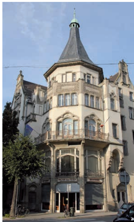
28. Façade du Palais des Fêtes