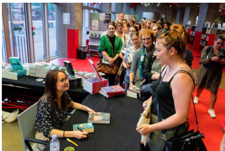
Rencontre du public avec Mélissa da Costa, l'autrice la plus vendue en France, à la médiathèque André Malraux

Cette année a permis d'offrir au public des rencontres avec des auteur·trices et intervenant·es prestigieux parmi lesquelles: Fatou Diome , Augustin Trapenard , Mélissa da Costa , Serge Bloch , Daniel Pennac , Mathieu Sapin , Catherine Dolto , ou encore Delphine Horvilleur .