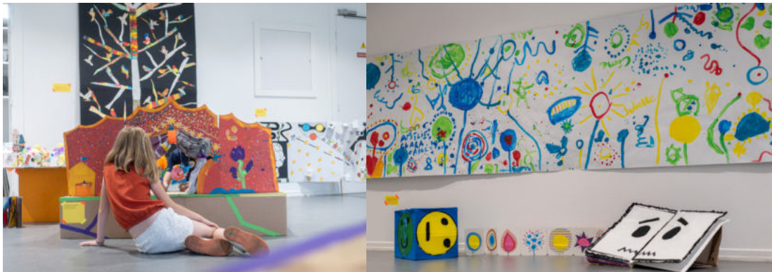
Exposition Toutencouleurs à l'Artothèque de Neudorf, réalisée en partenariat avec 8 périscolaires d'écoles strasbourgeoises autour de l'univers coloré de l'auteur et illustrateur Hervé Tullet.

Les bibliothécaires ont été impliqués dans de nombreux projets au cours de l'année, en particulier sur les enjeux d'éducation et d'accès à la lecture dès le plus jeune âge : création de parcours d'éducation artistique et culturelle pour les scolaires, accompagnement de la rénovation de bibliothèques d'écoles, projets avec des périscolaires comme l'exposition Toutencouleurs , etc.