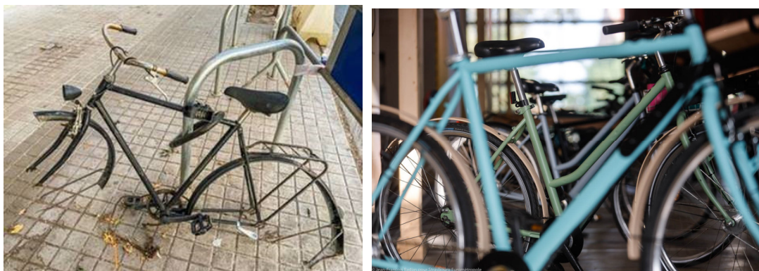
© Ville et Eurométropole de Strasbourg

Régulièrement collectés par la Ville (plus de 1500 en 2024), les vélos épaves sont ensuite distribués à des acteurs locaux de l'autoréparation et de réparation solidaire du territoire (Savoir et compétences Emploi, Emmaüs, A'cro du vélo, Bretz'selle, Vélo Station Strasbourg). Leurs missions contribuent à remettre en état les deux-roues de façon à les rendre utilisables et sécurisés et ainsi développer une gamme de vélo reconditionnés (d'occasion) accessibles à tous les budgets. Ces différents acteurs collectent plus de 6000 vélos chaque année tous donateurs confondus, dont plus de 3400 sont remis sur le marché (don et ou vente) soit une remise sur le marché atteignant près de 60 %.