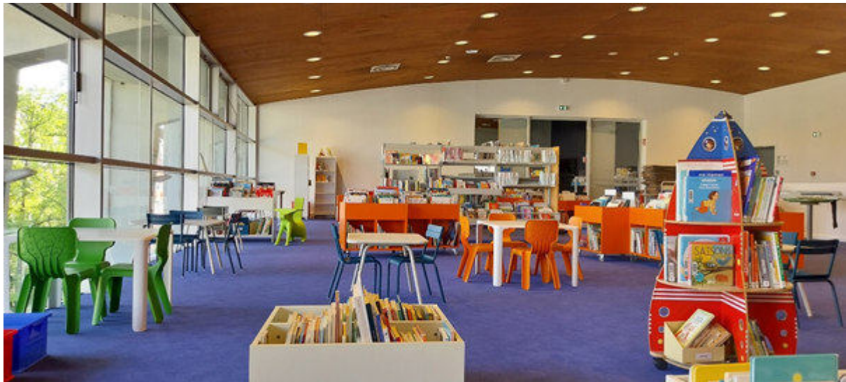
L'espace jeune public de la médiathèque Neudorf, rénové en avril 2024

NB : les médiathèques vont être intégrées au dispositif 100% EAC de la Ville de Strasbourg (CTEAC - Contrat territorial Éducation artistique et culturelle)