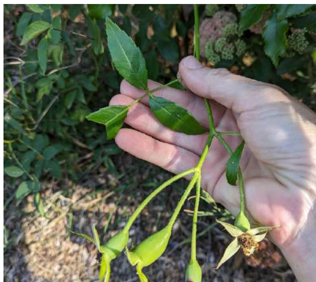
FEUILLE À 3 FOLIOLES SOUS DES FLEURS FANÉES DE ROSIER