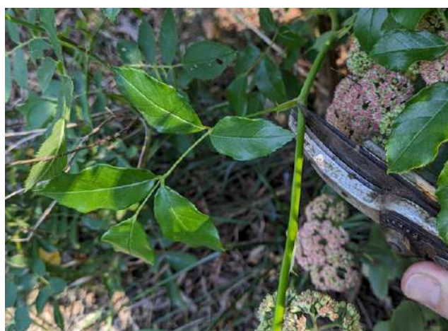
TAILLER JUSTE AU-DESSUS DE LA FEUILLE VRAIE