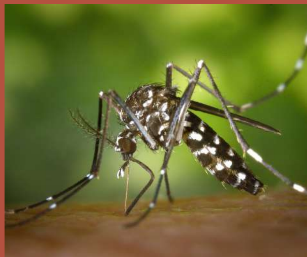
MOUSTIQUE TIGRE FEMELLE

En réponse à cette injection de salive, notre corps va produire un composé chimique, de l'histamine, qui est responsable de la sensation de démangeaison.