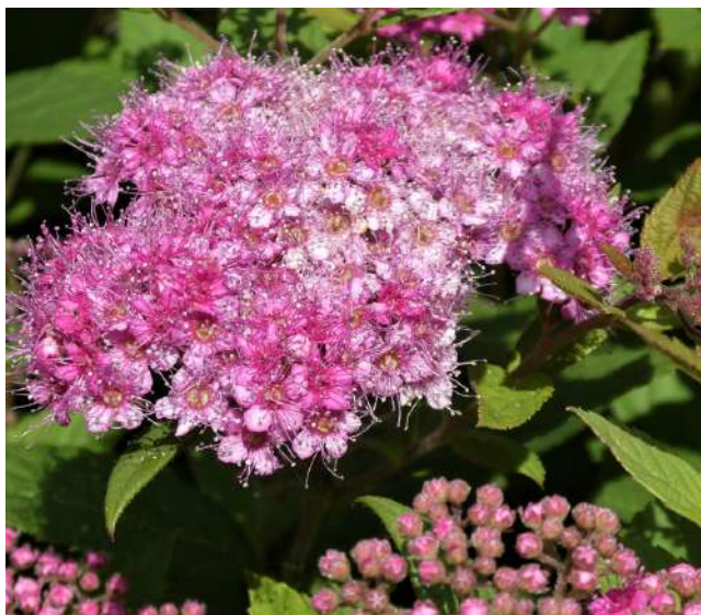
SPIREE DU JAPON

Attention, pas plus de 20% de déchets de résineux !