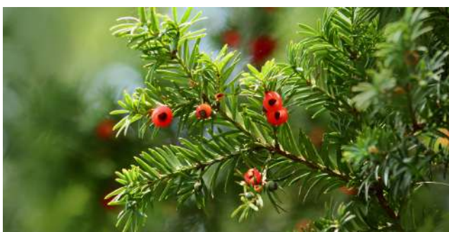
IF - TAXUS BACCATA

Un conifère ne se taille pas sauf si le choix s'est porté sur une haie au carré. L'if convient bien à la taille. Les autres conifères (thuyas...) ne sont pas adaptés sauf si des pesticides sont utilisés pour lutter contre les prédateurs et les maladies. Comme ces produits sont interdits, leur conduite en haie taillée est compliquée et vouée à l'échec !