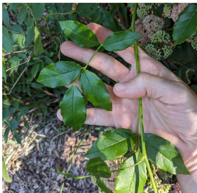
1ÈRE FEUILLE VRAIE À 5 FOLIOLES SITUÉE PLUS BAS