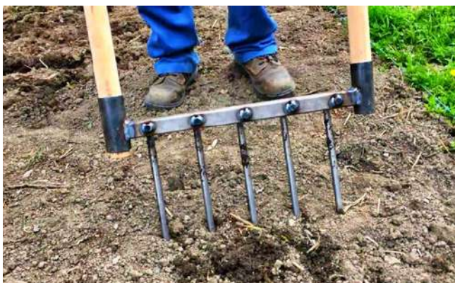
GRELINETTE POUR DÉCOMPACTER LE SOL

Le sol de cet espace demande au moins un décompactage sur les rangs des futurs semis de haricots, de petits-pois ou de fèves (tous les 50 cm), ou futures plantations de pommes de terre (tous les 70 cm).