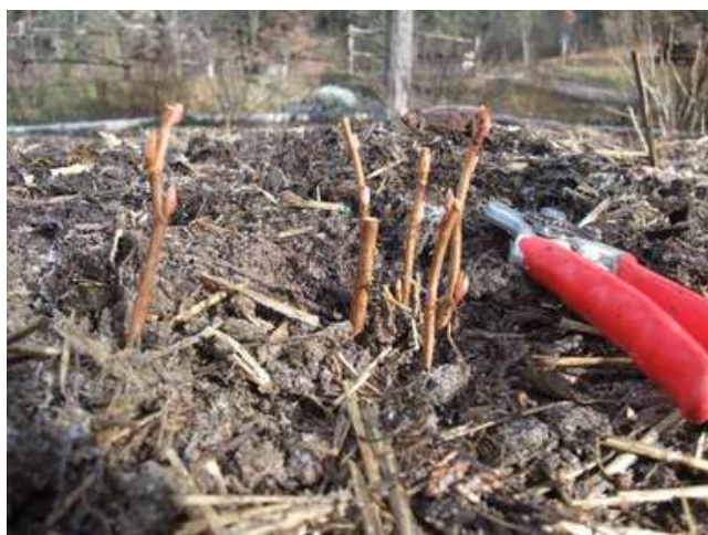
BOUTURES EN PLEINE TERRE

Côté petits fruits, tous les arbustes sont plantés, taillés ou bouturés jusqu'en mars.