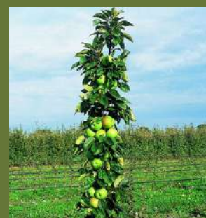
POMMIER COLONNAIRE 'AMBOISE'