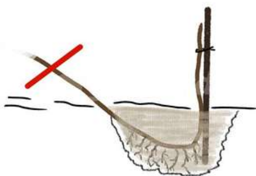
PRÉLEVEMENT D'UNE MARCOTTE

L'automne est également le bon moment pour marcotter les groseilliers et cassisiers : si, en nettoyant vos plants, vous remarquez des branches touchant le sol, vérifiez si elles ont émis des racines. Il vous suffira alors de couper ces branches et de les replanter directement en pleine terre ou en pot pour multiplier vos plants !