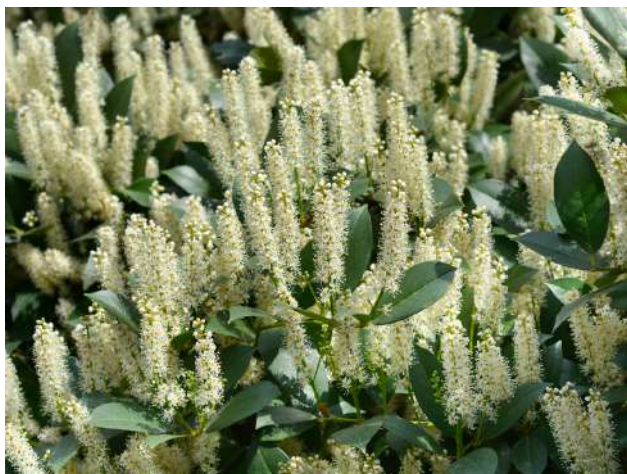
LAURIER CERISE EN FLEURS

- Les arbustes à floraison estivale (spirée rose...) et ceux à feuilles (troène, laurier cerise, charmillé...) sont taillés jusqu'en mars.