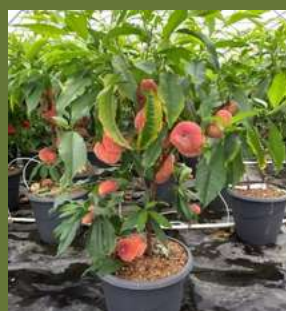
PÊCHER NAIN 'DIAMOND'

Ne rentrez surtout pas vos fruitiers en hiver et ne leur mettez pas de voile d'hivernage ! Le froid est indispensable à leur cycle naturel et ils ne craignent absolument pas le gel !