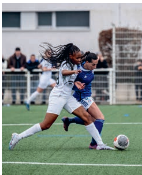
Les Strasbourgeoises sont en concurrence avec Nantes et Marseille pour la montée.