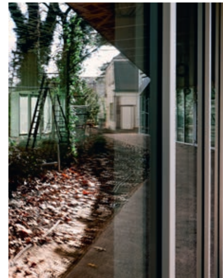
Une extension a été construite dans le parc.

À la Robertsau, le Lieu d'Europe rouvre ses portes au public le 13 mars, après un an de travaux.