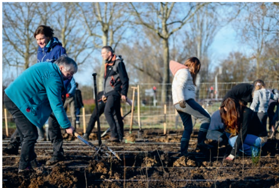
Près de 250 personnes ont participé à la plantation de la petite forêt du Grand pré à l'entrée du quartier.

Deux projets lauréats du budget participatif, situés le long de cet axe, mettent le quartier en valeur.