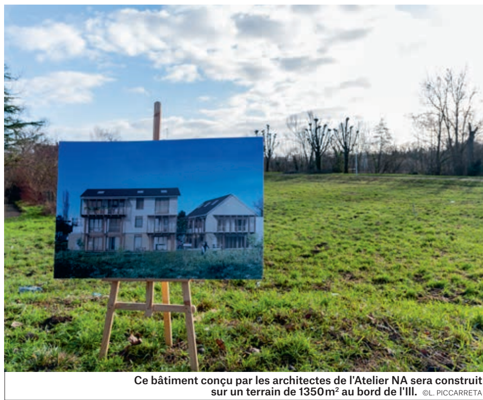
Ce bâtiment conçu par les architectes de l'Atelier NA sera construit sur un terrain de 1350m 2 au bord de l'Ill.

chambre d'amis partagée et sera bordé de 350 m 2 d'espaces extérieurs collectifs. La paille servira d'isolant et les menuiseries ou encore les aménagements extérieurs seront réalisés grâce à des matériaux de réemploi fournis par l'association Boma. «Nous avons découvert le concept en 2020. Nous y avons vu l'occasion de