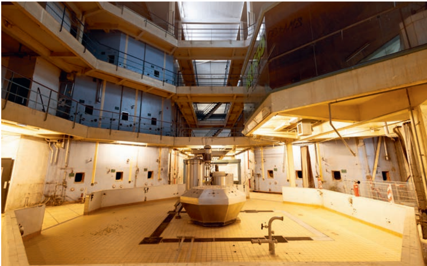
Le vin était stocké dans de multiples cuves installées sur quatre niveaux.