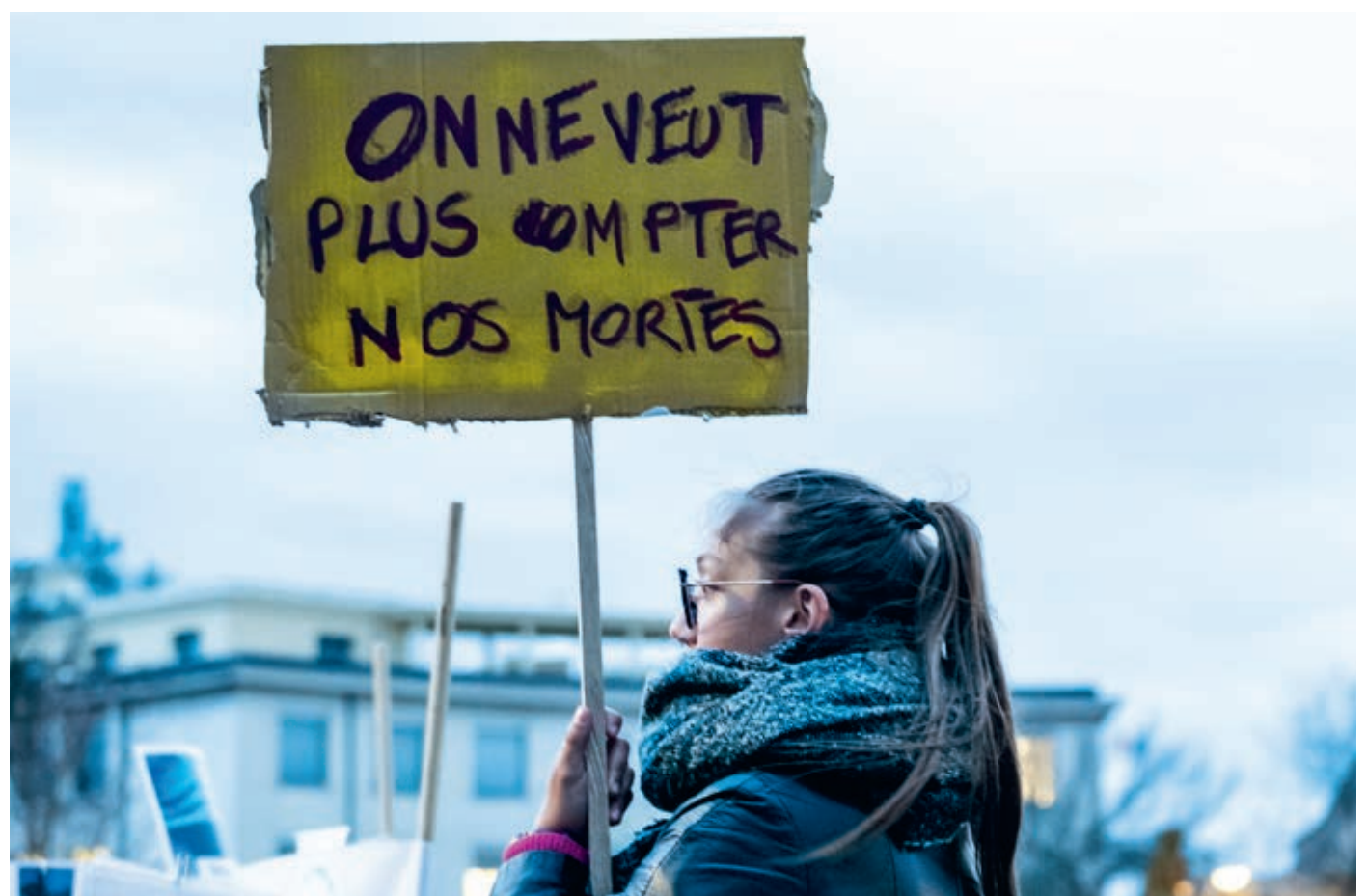
Le 8 mars est l'occasion de mettre en lumière les violences vécues par de nombreuses femmes.

PÉRENNISER L'ORDONNANCE VERTE. En parallèle, la municipalité s'engage contre la précarité menstruelle. Près de 11000 Strasbourgeoises en seraient victimes. Pour leur permettre de se procurer gratuitement des protections périodiques, 18 distributeurs ont été déployés dans différents endroits de la ville (toilettes publiques, médiathèques, piscine, gymnase, centres médico-sociaux, mairies de quartier...). Ce travail sur la santé passe également par l'accompagnement des femmes enceintes. Pour prévenir l'exposition des futures mères et de leurs enfants aux perturbateurs