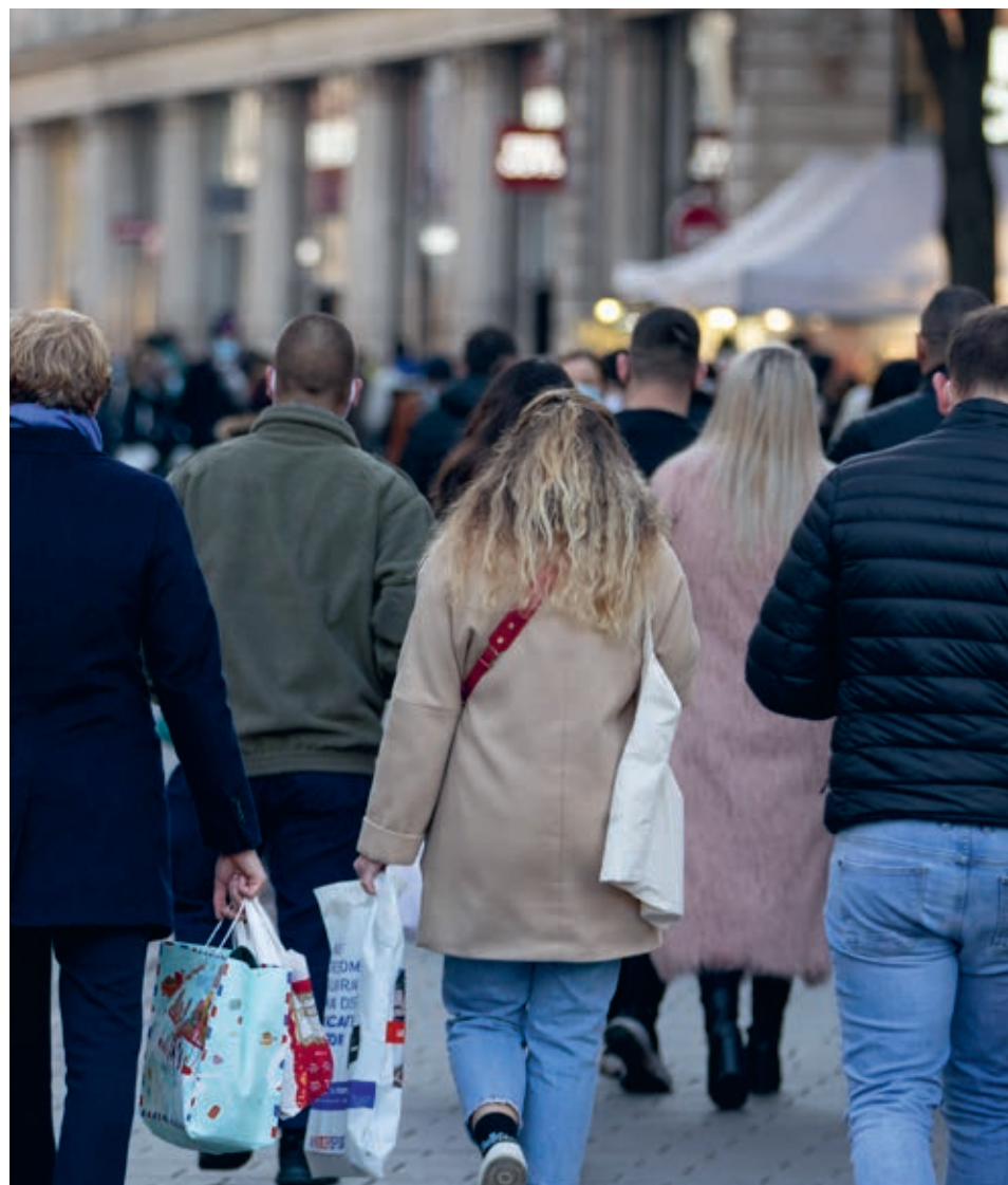
La mesure vise à préserver le dynamisme des cœurs de quartier en maintenant une diversité d'activités.

STRASBOURG.EU/DROIT-DE- PREEMPTION-COMMERCIAL