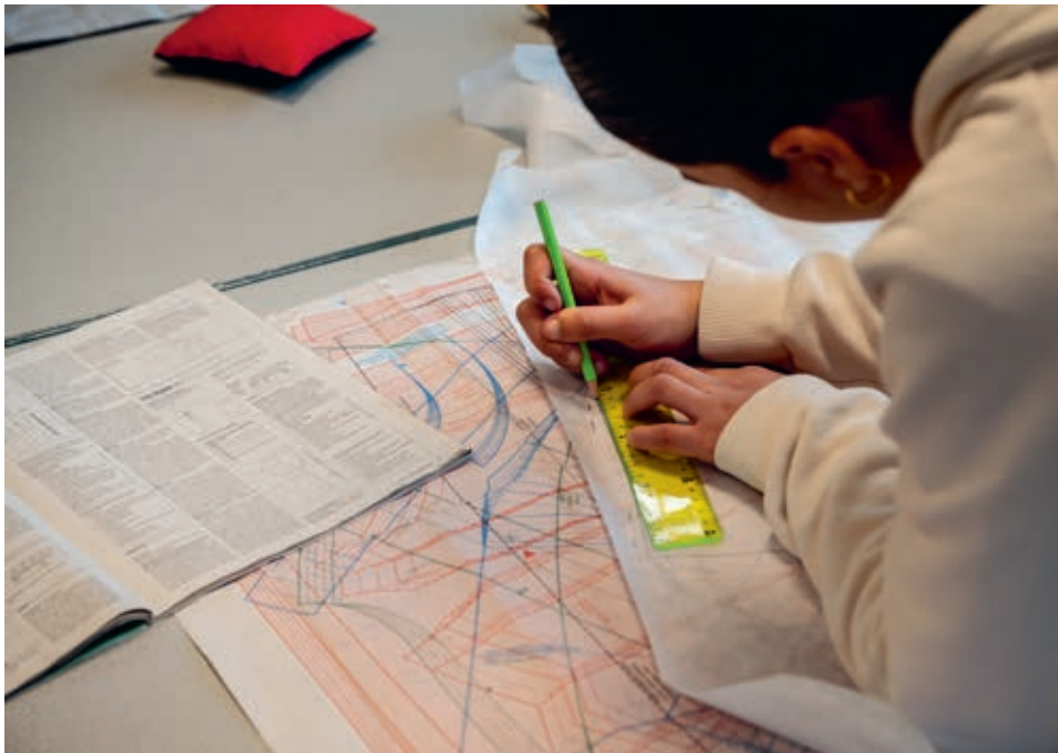
Le centre social et culturel Le Galet organise à HautePierre des activités pour tous les publics.