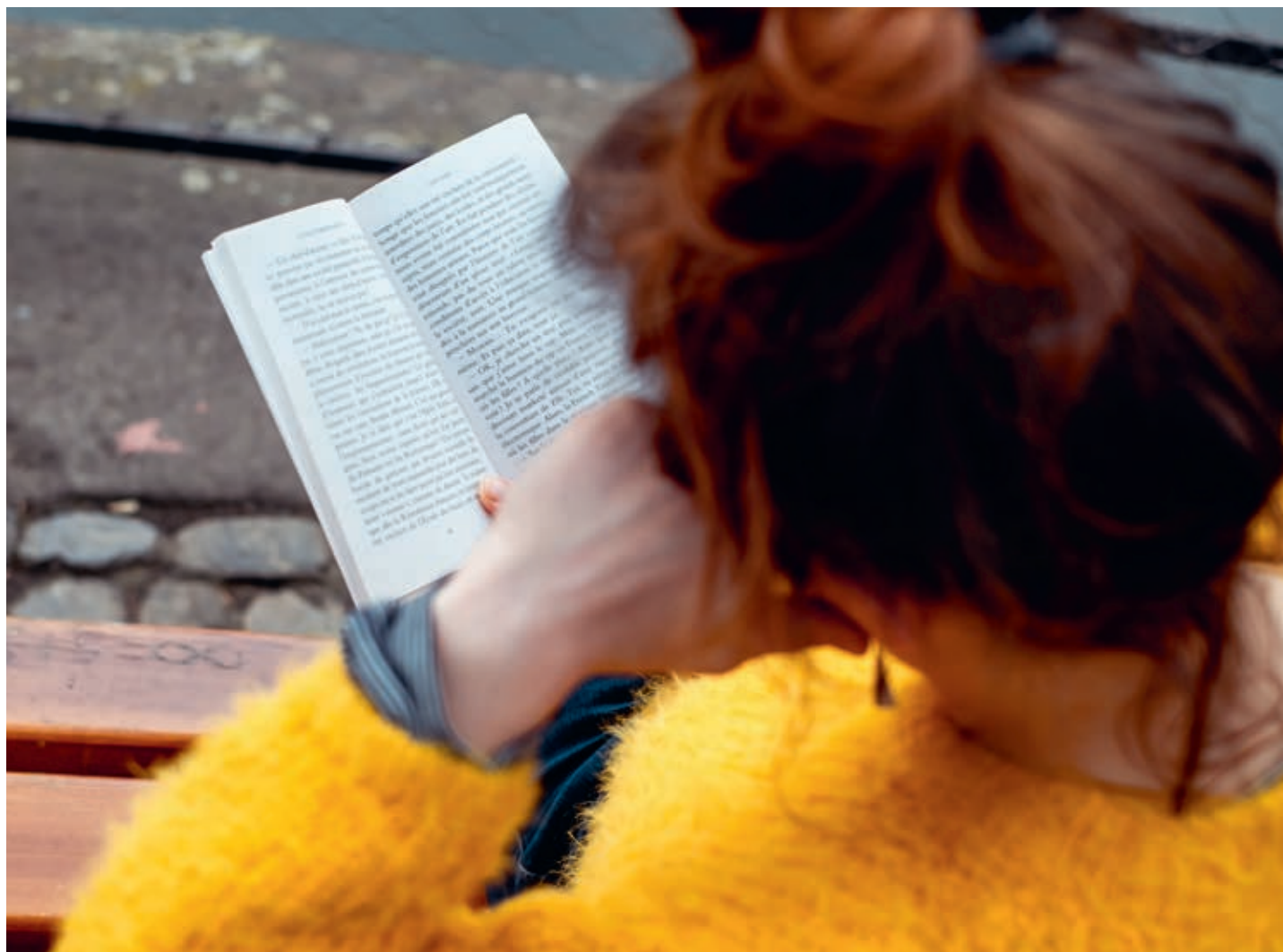
Plumes reconnues, artistes et anonymes sont invités à partager leur amour de la lecture.