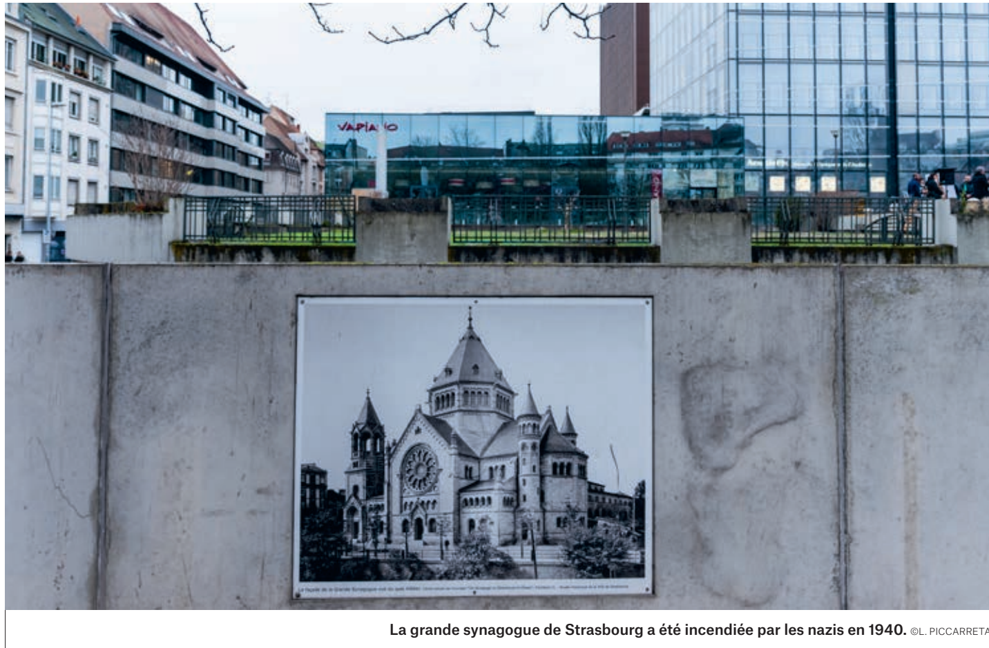
La grande synagogue de Strasbourg a été incendiée par les nazis en 1940.