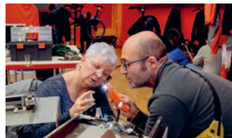
Réemploi et relations humaines font la paire.

perdent pas contact avec les participants. «Je leur dis de ramener le vélo dans notre atelier. Ça nous permet également de gagner en visibilité et de décroisser le Vieux Cronenbourg, d'en faire un lieu d'échanges», insiste Lucas, de l'association partenaire A'Cro du vélo. Le travail des bénévoles a permis jusqu'ici de sauver 246 kg d'objets de la déchetterie et d'en réparer 85 sur les 118 passés entre leurs mains. Un taux de réussite à entretenir dès le prochain RepairCafé, le 6 avril. {LB}