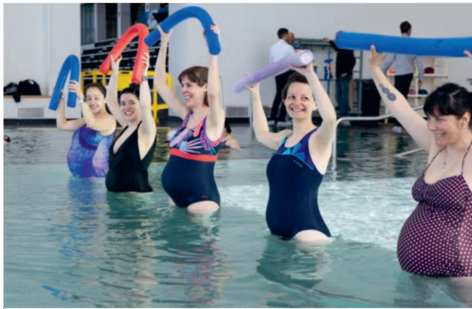
Le dispositif de sport-santé sur ordonnance est ouvert aux femmes enceintes ou en post-partum.