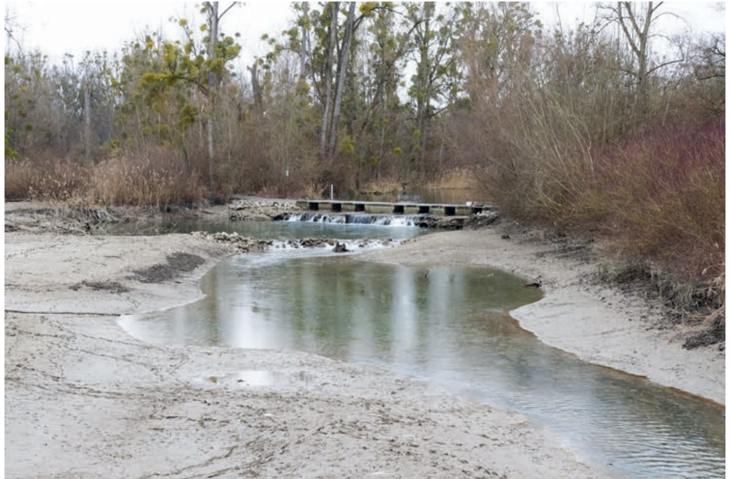
L'exercice a consisté à faire reculer de deux mètres la hauteur de l'ancien bras du fleuve.

Pendant une semaine, le niveau d'eau du Vieux Rhin a été abaissé pour une opération de maintenance du barrage de Kehl-Strasbourg. Les milieux humides de l'île du Rohrshollen ont pu être préservés.