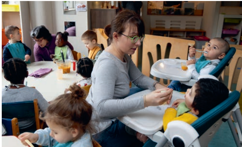
La micro-crèche de l'association accueille les enfants du quartier tout en développant une activité d'insertion et de formation.

Depuis 2007, l'association Par enchantement réinvente la vie à Koenigshoffen avec et pour ses habitant·es.