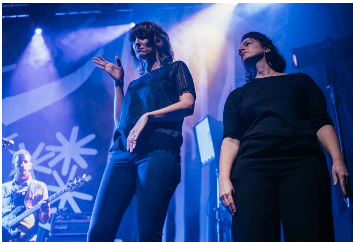
Des concerts chansignés sont proposés aux personnes sourdes ou malentendantes.