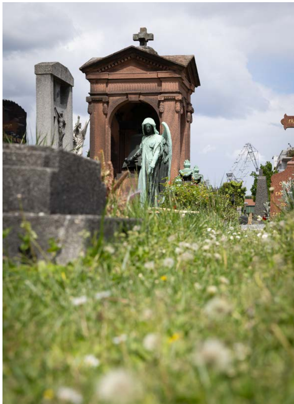
Le cimetière abrite des centaines de monuments, dont les plus anciens datent du début du XIX e siècle.

GUIDE DES CIMETIÈRES N°1, STRASBOURG-NEUDORF, CIMETIÈRE SAINT-URBAIN, VILLE DE STRASBOURG, 2007 (DISPONIBLE À L'ENTRÉE DU CIMETIÈRE)