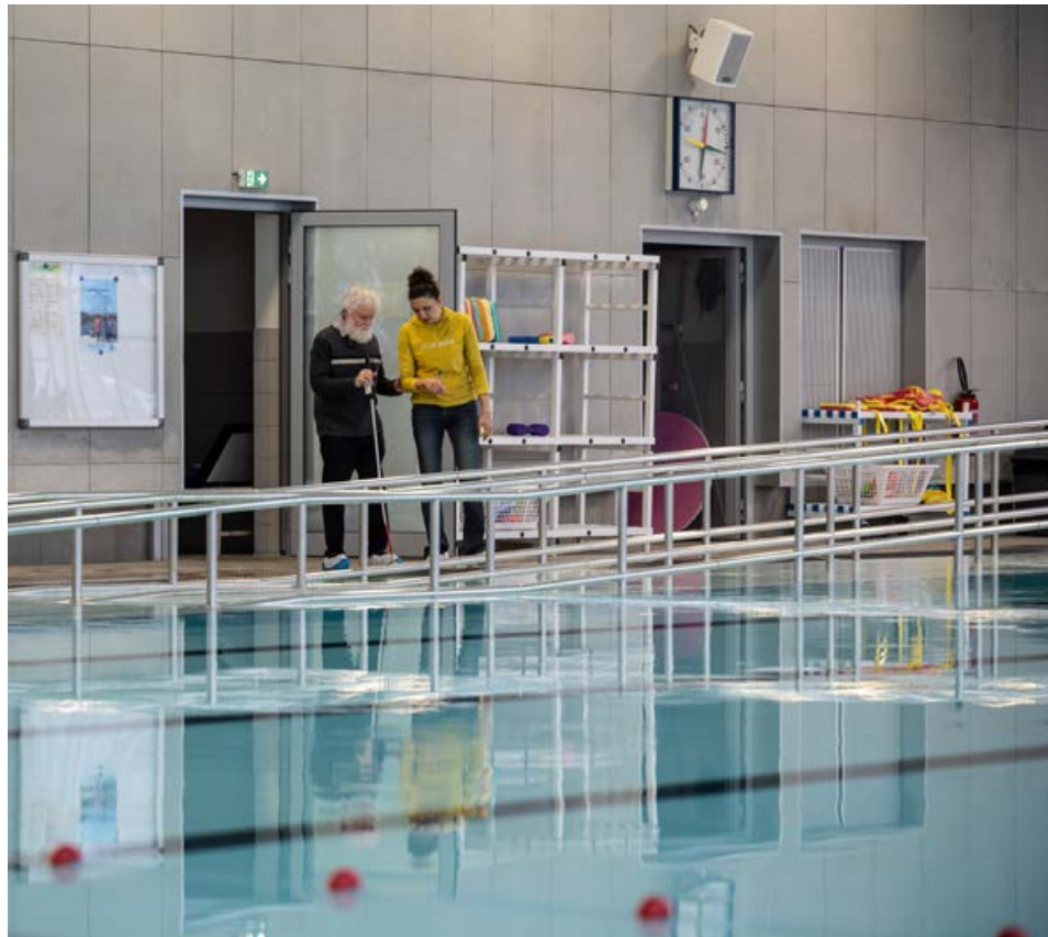
Des visites sont organisées pour identifier les freins à l'autonomie des nageurs handicapés.