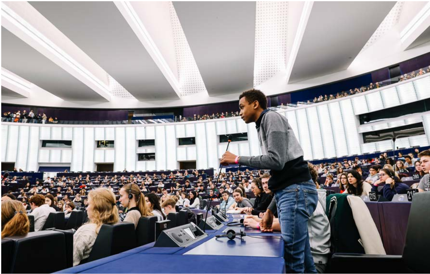
Une séance de questions-réponses a eu lieu entre les jeunes et le vice-président.