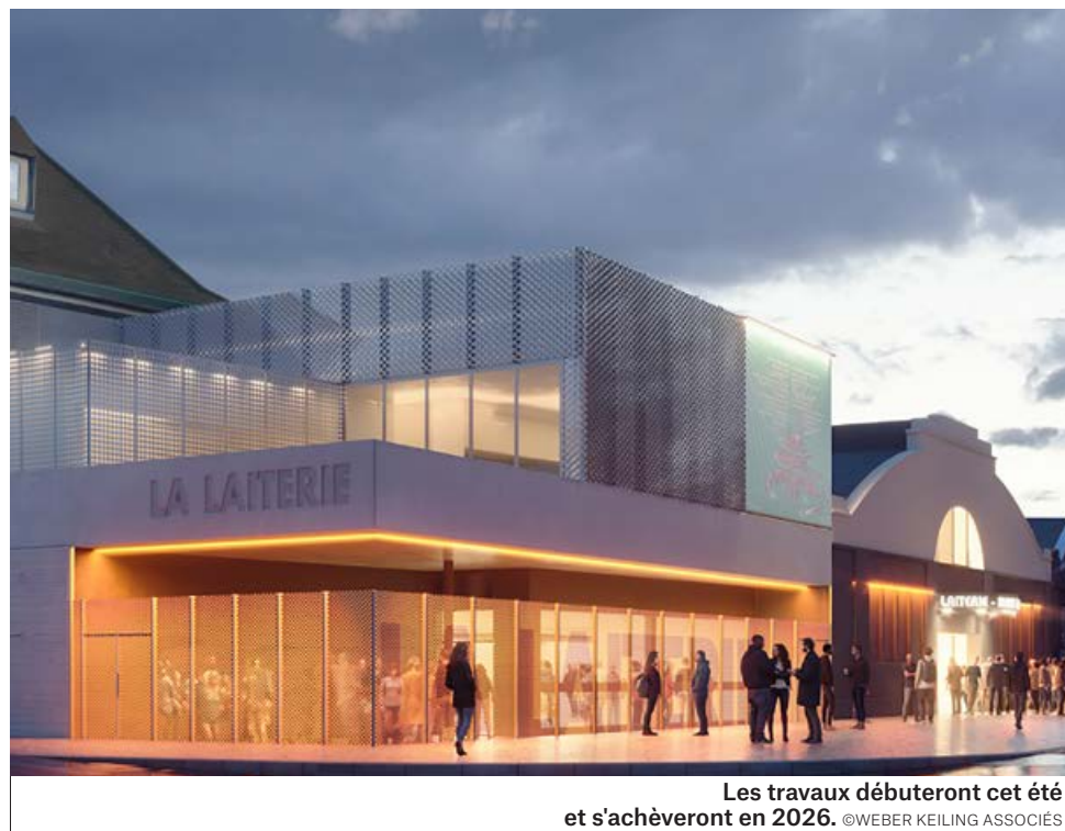
Les travaux débuteront cet été et s'achèveront en 2026. ©WEBER KEILING ASSOCIÉS

«Pour augmenter la jauge de 870 à 1164 personnes, nous allons prolonger les gradins. Cela implique de surélever le plafond de la salle: une intervention sur le gros œuvre sera donc nécessaire pour créer une nouvelle charpente et la structure pour la soutenir», poursuit l'architecte. Au premier étage, des loges individuelles et collectives seront aménagées. Des panneaux photovoltaïques et des matériaux isolants limiteront la consommation énergétique. Une enveloppe de 9,5 millions d'euros est prévue pour cette rénovation. «Les différents usagers du lieu, qu'il s'agisse du public, des artistes, des équipes techniques ou encore du voisinage, ont été placés au cœur du projet», apprécie Thierry Danet, le directeur de la Laiterie. «Ce programme architectural permettra à la Laiterie de s'adapter aux enjeux contemporains et de se projeter dans l'avenir», complète Anne Mistler, adjointe à la maire en charge des arts et de la culture. {LG}