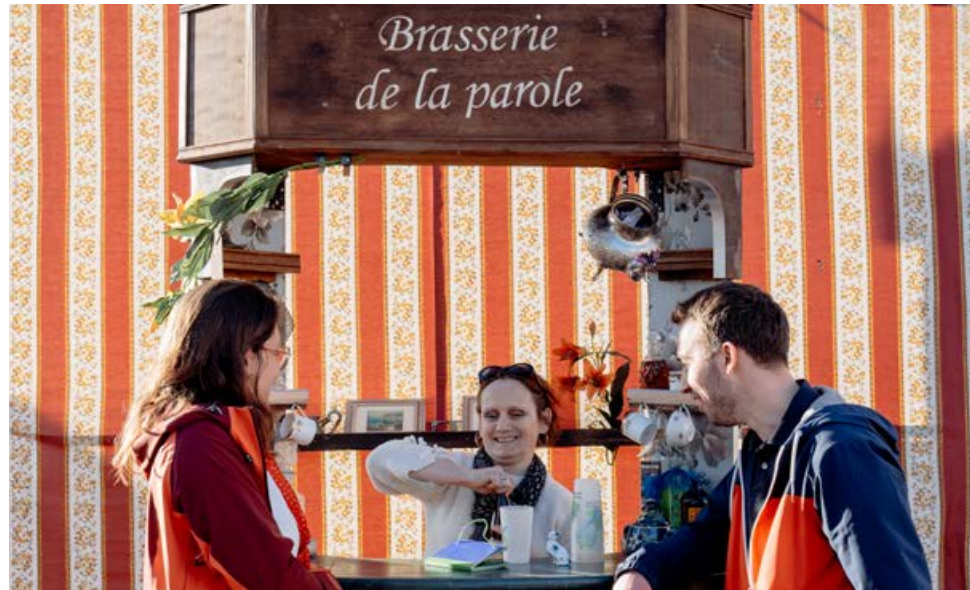
Un verre contre un propos: en octobre et en mars, la place a été transformée en lieu d'échanges.

La Brasserie de la parole, imaginée par le CSC et la compagnie les Arpentistes, fait partie des 17 projets retenus par la Ville et a permis de transformer temporairement, en octobre et en mars, la place d'Ostwald en terrasse conviviale. Là, les passantes et passants ont pu venir s'attabler et «échanger» un verre contre un «souvenir, un coup de cœur, un coup de gueule»,