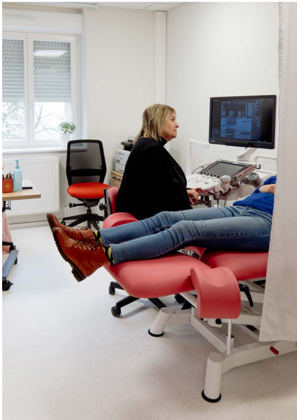
Suivi gynécologique, préparation à l'accouchement et échographies peuvent être pratiquées sur place.

La Maison urbaine de santé du quartier réunit un écosystème de soignants-es au service de la population.