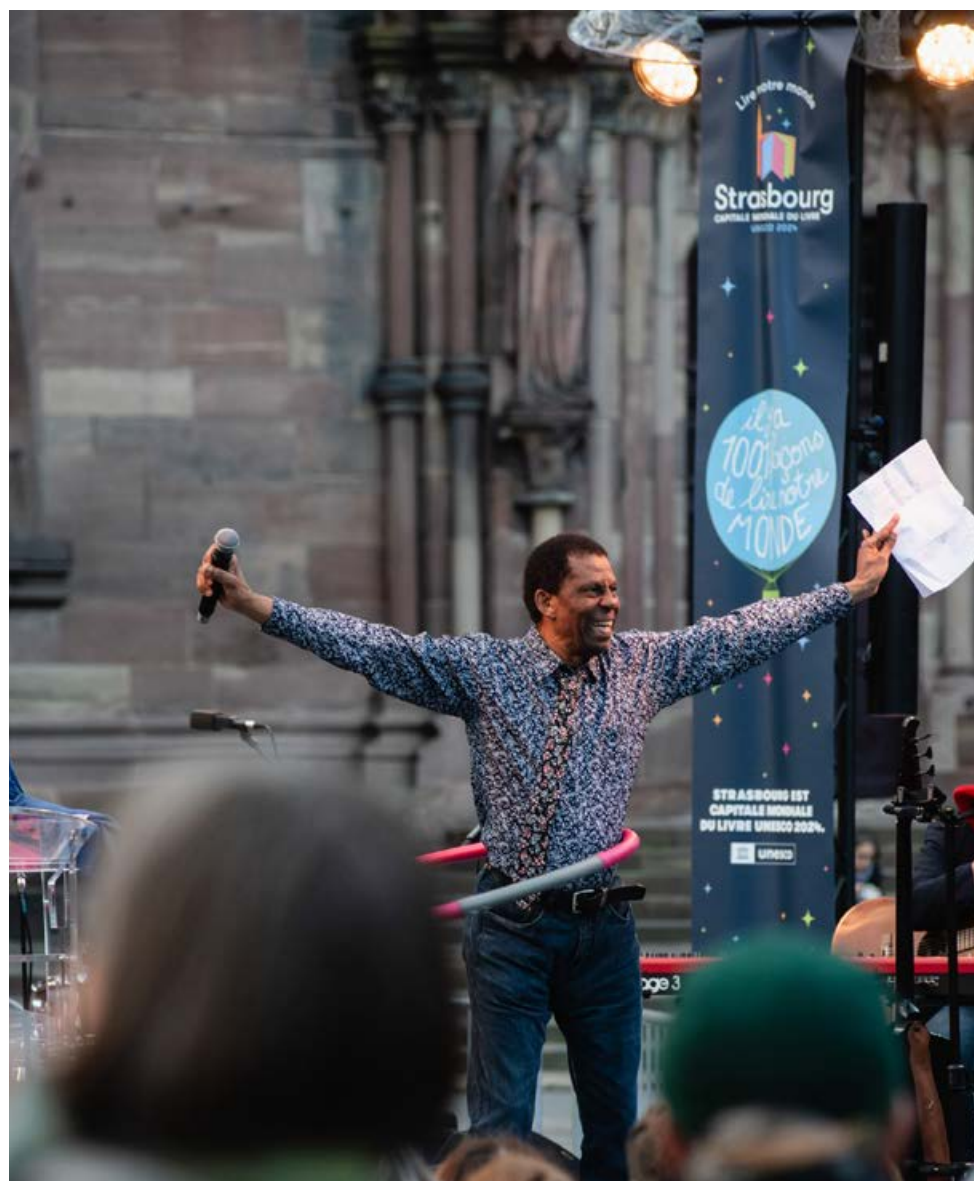
Dany Laferrière a su allier, avec humour, lecture et hula-hoop.