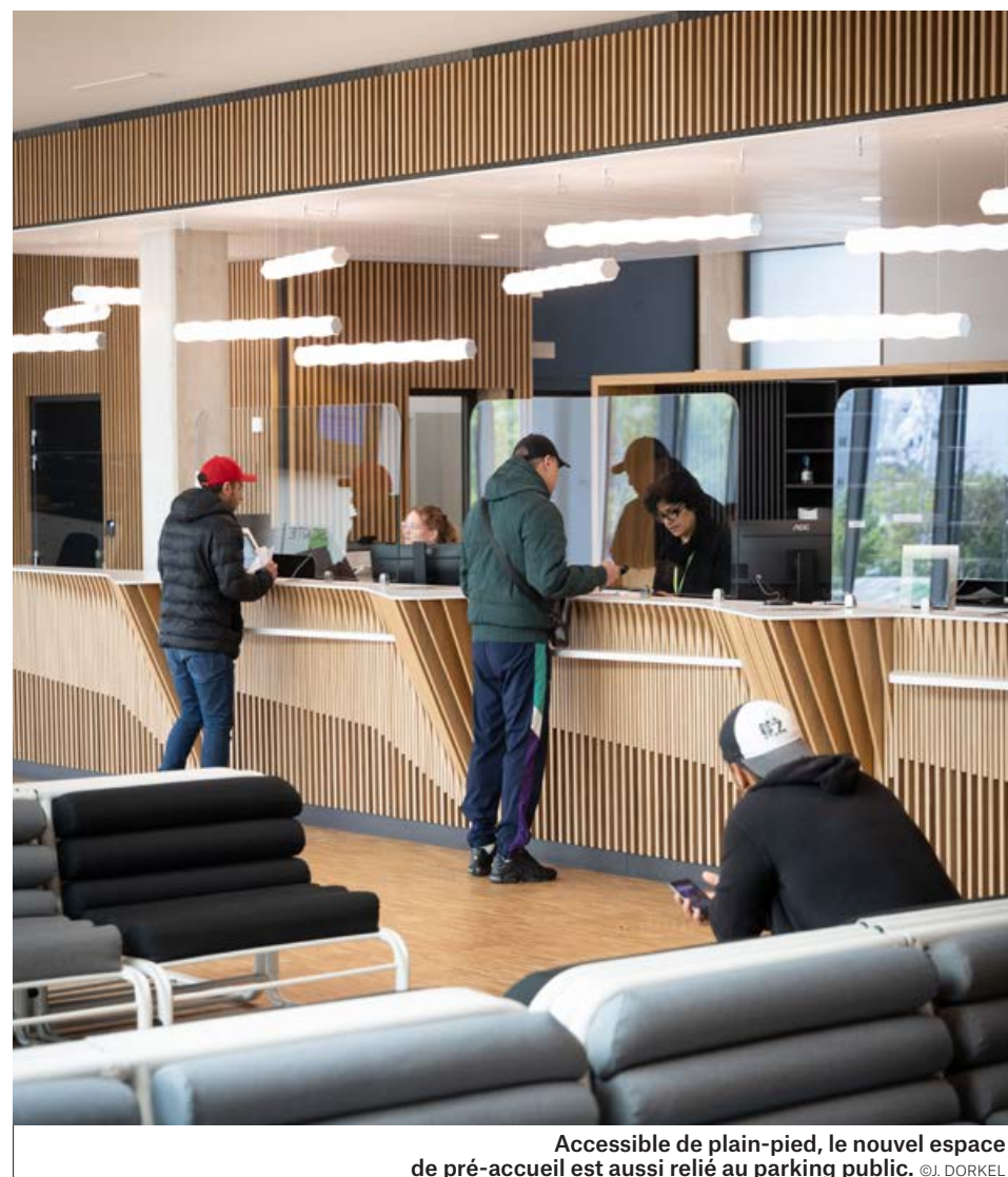
Accessible de plain-pied, le nouvel espace de pré-accueil est aussi relié au parking public.

DÉMARCHES EN LIGNE ACCESSIBLES SUR MONSTRASBOURG.EU