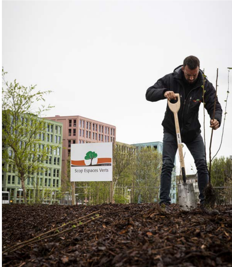
Avant les plantations, le sol a été travaillé pour le rendre à nouveau vivant.

Depuis le 4 avril, le site web strasbourg.eu affiche sa nouvelle identité: fond sombre pour réduire les coûts énergétiques, couleurs contrastées pour une meilleure accessibilité, architecture plus adaptée à la lecture sur smartphone. Plus sobre et plus accessible, la newsletter l'est aussi avec un changement de format et de périodicité, qui devient hebdomadaire. Sur le site, les articles d'actualité sont mis en avant dès la page d'accueil, où l'on retrouve également un moteur de recherche et une navigation par profil usager ou par thématique. {LG}