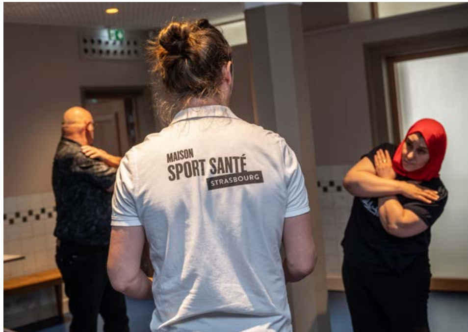
Depuis 2012, plus de 5000 personnes ont pu bénéficier d'activités physiques adaptées à leurs pathologies.