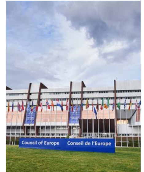
Conférences, expositions et podcasts sont prévus.

Né en 1949 au sortir de la Seconde Guerre mondiale, le Conseil de l'Europe fête cette année son 75 e anniversaire.