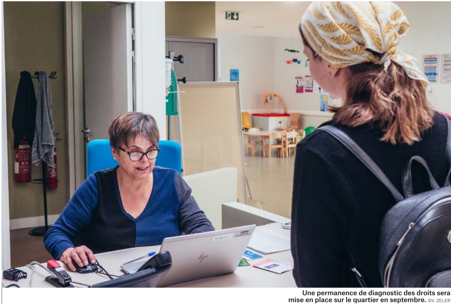
Une permanence de diagnostic des droits sera mise en place sur le quartier en septembre.