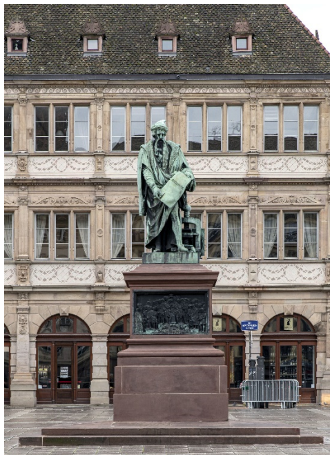
Place Gutenberg.