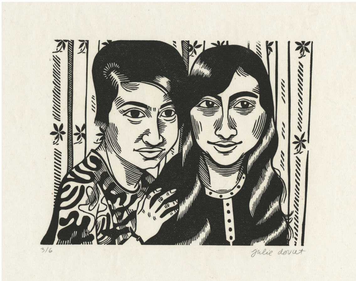
Julie Doucet , untitled, from the Melek serie, 2002 Copyright Julie Doucet