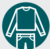
Vêtements amples et couvrants