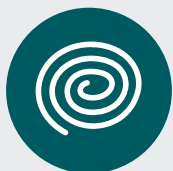
Serpentins à l'extérieur